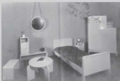
□ Sliki spalnice iz kataloga C.A.M.