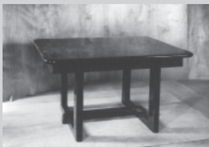
□ Slika mizice

Konstrukcije pohištva se niso spreminjale, spreminjale so se le oblike.