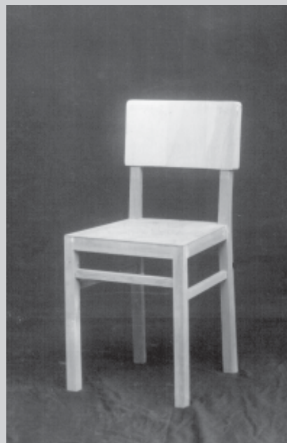
□ Slika stola

Delavnice v Solkanu so se razlikovale po tem, za kaj je bil kdo specializiran, bilo pa je tudi nekaj "boljših" delav-