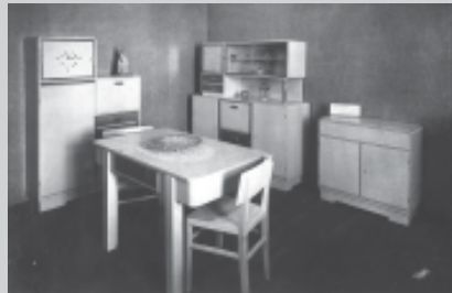
□ Slika kuhinje iz kataloga C.A.M.