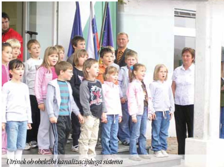
Utrinek ob obeležbi kanalizacijskega sistema