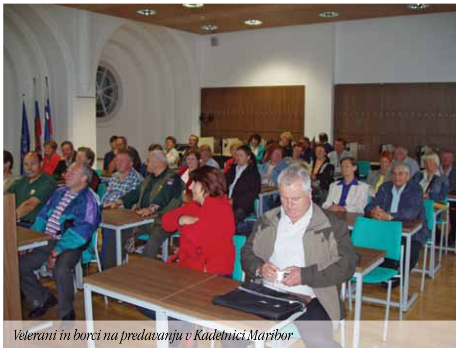
Veterani in borci na predavanju v Kadetnici Maribor

Naprej nas je pot vodila proti vasi Sovjak, Sv. Jurij ob Ščavnici. Na kmetiji Kocuvan so nam pripravili tradicionalni prekmurski bograč, k tako dobri jedi pa spada tudi dobra kapljica, katere seveda ni primanjkovalo. Za sladokusce pa je poskrbela gospodinja, saj nam je postregla z dobro makovo potico. Ni potrebno posebej govoriti, da nam je vse šlo odlično v slast. Tudi zaplesalo in zapelo se je, saj smo imeli s seboj muzikanta, ki nam ni pustil počivati.