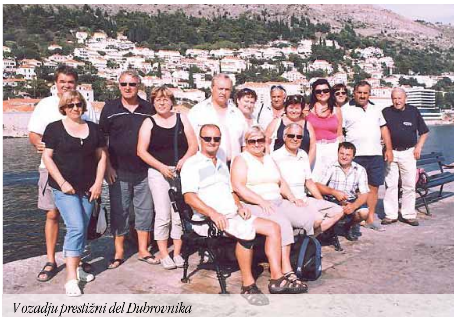
Vozadju prestižni del Dubrovnika