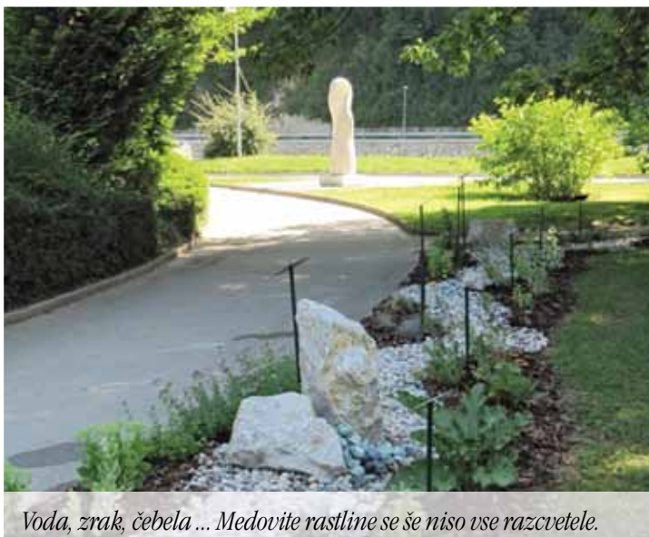
Voda, zrak, čebela ... Medovite rastline se še niso vse razcvetele.

Projekt, kakor je zastavljen, bi bil za nas čebelarje prevelik zalogaj, zato potrebujemo pomoč, ki pa smo jo dobili pri STIK-u Laško, Thermani d.d. Laško ter Društvu za raznolikost podeželja, za kar smo jim izredno hvaležni. Ob izdatni pomoči omenjenih smo že pričeli izvajati II. fazo projekta. Omenim naj le sodelovanje v paradi na 45. prireditvi »Pivo in cvetje«, ki je ob sodelovanju raznih društev predstavilo čebelarstvo dejavnost, tako pomembno za slovenska tla. Odziv na prikazano je izjemno dober, za kar se vsem sodelujočim v imenu vseh čebelarjev in v svojem imenu iskreno zahvaljujem.