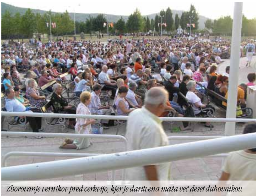
Zborovanje vernikov pred cerkvijo, kjer je daritvena maša več deset duhovnikov.