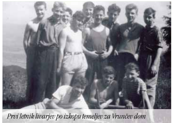
Prvi letnik livarjev po izkopu temeljev za Vrunčev dom

3. 3. 1943 sem bil prisilno mobiliziran in 22. 8. 1943 že poslan na fronto. 25. 8. isto leto sem bil ranjen in odveden v Kremenčuk ter bil dvakrat operiran na desnem očesu. Zdravnik mi je rekel: »Oko vam bomo poskusili rešiti, da ne boste nosili steklenega, a vida vam ne moremo dati.« Po štirimesečnem zdravljenju v Konstanzu sem bil ponovno poslan na fronto v Moldavijo, kjer je bila celotna nemška vojska zajeta (obkoljena) in tako sem postal ruski ujetnik pri mestu Jasy, kasneje sem bil odpeljan z vlakom preko Urala v Čeljabinsk. Vsak dan smo delali v tovarni, podobni štorovski železarni, tudi pozimi pri -50 stopinjah Celzija, seveda oblečeni v ruska oblačila. 30. 9. 1945 so Avstrijci (podpisana lista med okupirano Avstrijo in Rusijo) sestavili transport in nas 4. 10. 1945 odpeljali proti domu in tako sem 30.