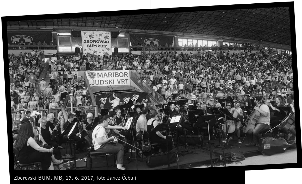
Zborovski BUM, MB, 13. 6. 2017