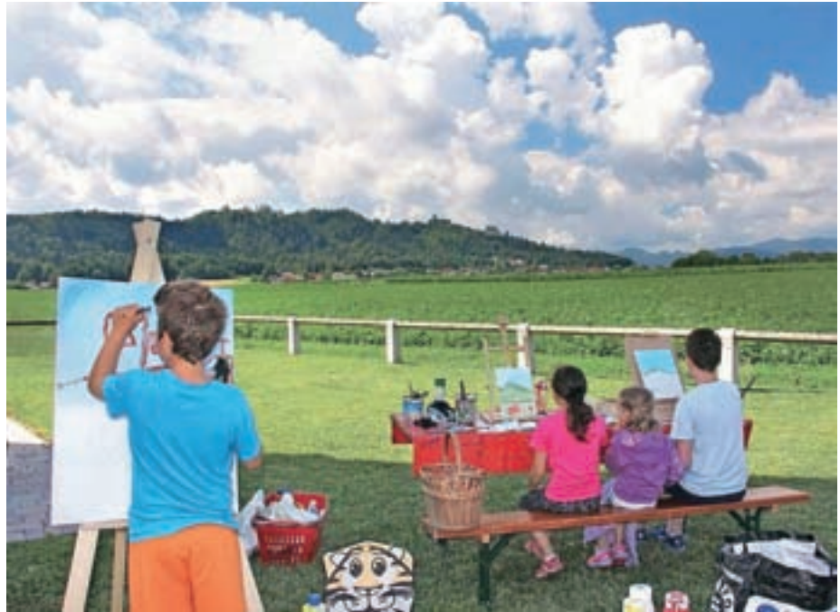
Povej, razvalina ... – mladi likovniki so pri ustvarjanju del pokazali svoje znanje.

V soboto, 1. julija, sta KUD JaReM in KUD Zbilje, v sodelovanju s Turističnim društvom Hraše in skupino Smleških pritrkovalcev, uspešno organizirala in izvedla likovni Ex tempore v Hrašah. Likovniki so upodabljali smleški grad po svojih likovnih predlogah in ustvarjali na prosto temo po svojem lastnem navdihu. Na brezplačni otroški delavnici, ki so jo podarili otrokom ob zaključku šolskega leta, pa so mladi upodabljali na temo Povej, razvalina ... Nastali so zelo zanimivi in raznoliki izdelki, ki so jih zvečer še istega dne razstavili ob cerkvenem zidu. Kulturni program so popestrili Mlajši smleški pritrkovalci, ki so na prenosljivih zvonovih izvedli nekaj melodij oziroma viž, kot jim pravijo sami. Po uspešnem dnevu so se organizatorji dogovorili, da naslednje leto izvedejo nagrajni likovni Ex tempore Hraše 2018.