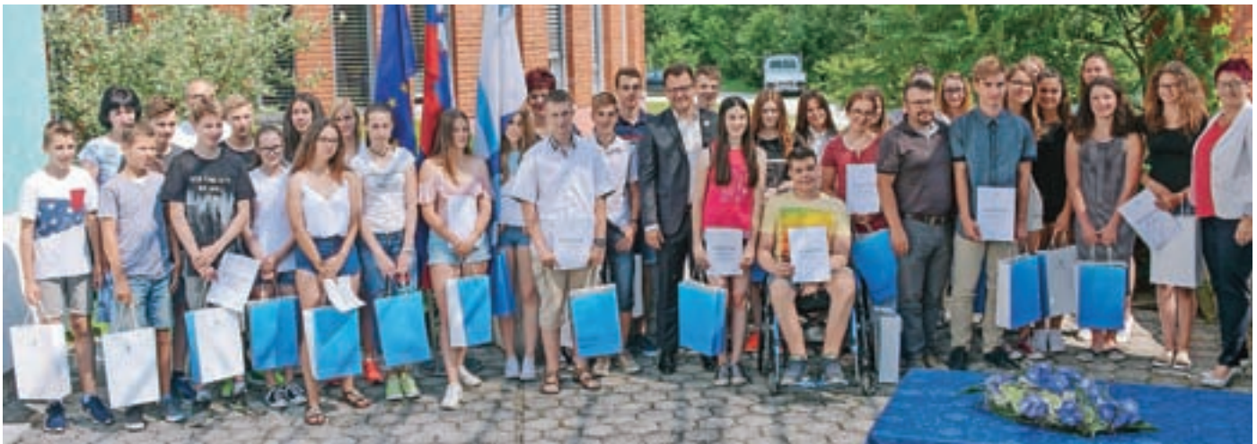
Najbolj uspešni devetošolci z županom, podžupanjo in ravnateljki medvoških osnovnih šol