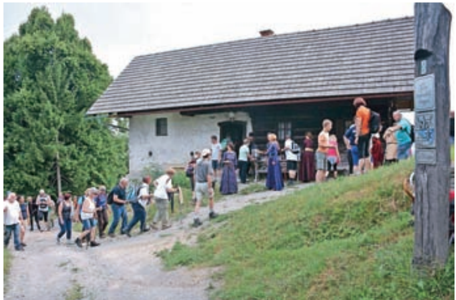
Najdaljši vmesni postanek so imeli pohodniki tradicionalno pri cerkvi sv. Marjete, kjer so jih postregle grajske gospe.