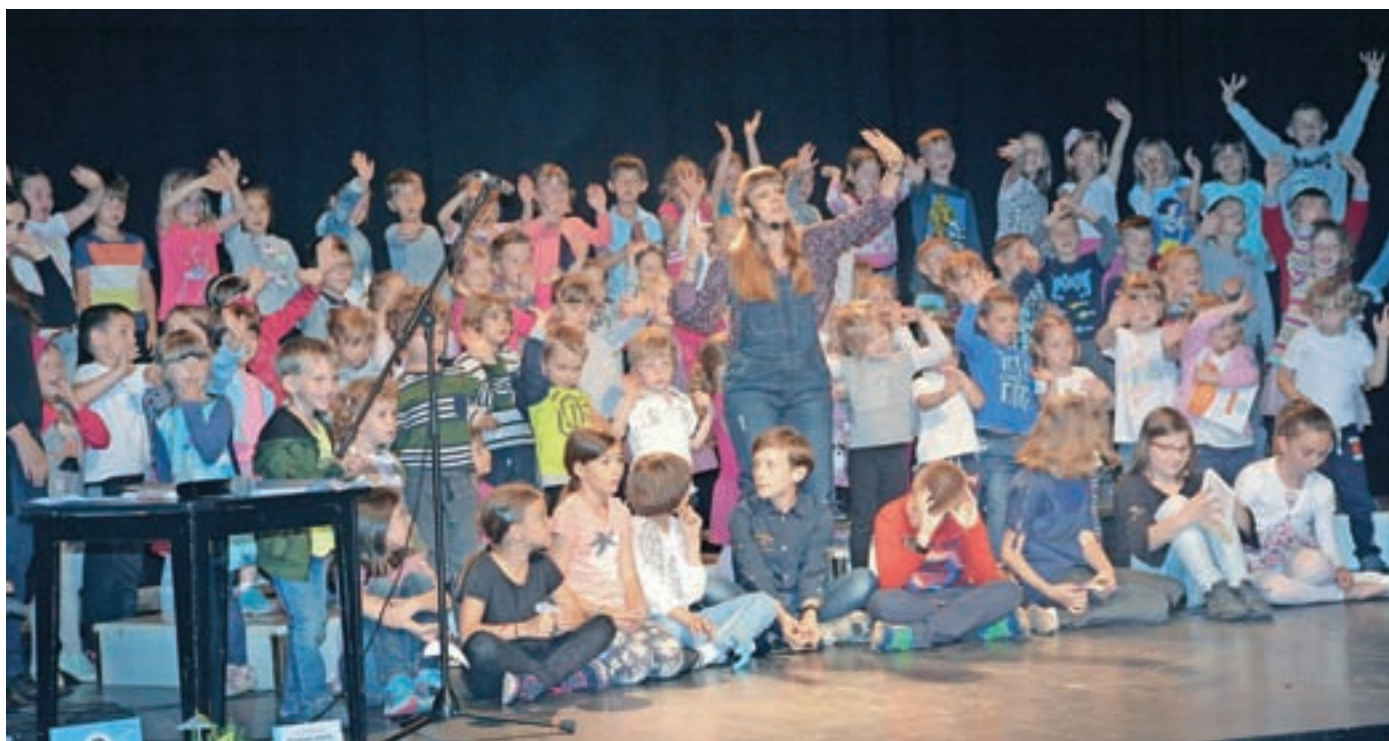
Utrinek z zaključne prireditve projekta Leo, leo