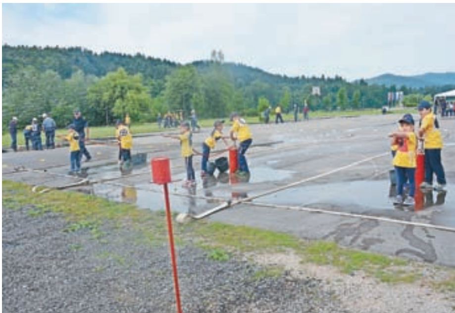
Tekmovali so tudi najmlajši gasilci. V ekipi jih je devet in v vaji z vedrovko so morali čim prej zbiti tarčo. To je bila ena izmed njihovih treh nalog na tekmovanju. Na sliki pionirji iz Zbilj.

PROJEKTIRANJE STAVB IN UREJANJE DOKUMENTACIJE za gradbeno dovoljenje.