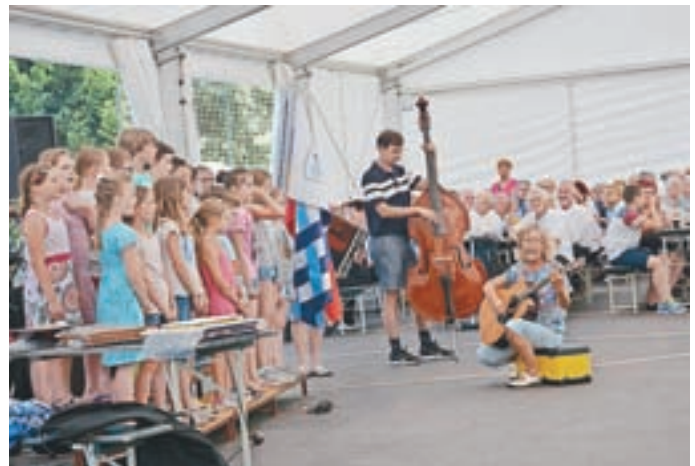
V kulturnem programu so nastopili tudi učenci OŠ Pirniče.