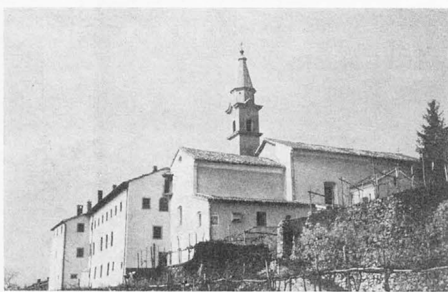
Kapucinski samostan v Vipavskem križu, kjer so bile od 8. do 11. oktobra letos proslave 350-letnice njegove ustanovitve

Za svečnika v čast sv. Cirila v baziliki sv. Klementa v Rimu: N. N., Opčine 50.000 lir.