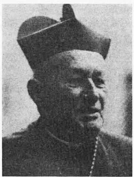
Pogumni pričevalec vere praški nadškof kardinal František Tomašek

Opomba ured: Možna je pa še ena protestna drža strankam in parlamentarcem: ostati doma in ne glasovati. Zakon tudi to predvideva, ker nihče ni dolžan udeležiti se referenduma. Jezuitska revija, Agiornamenti Sociali v novembrski številki jemlje v poštev tudi bojkot referenduma zato, da bodo stranke in parlament razumeli, kaj so njihove dolžnosti in pri-