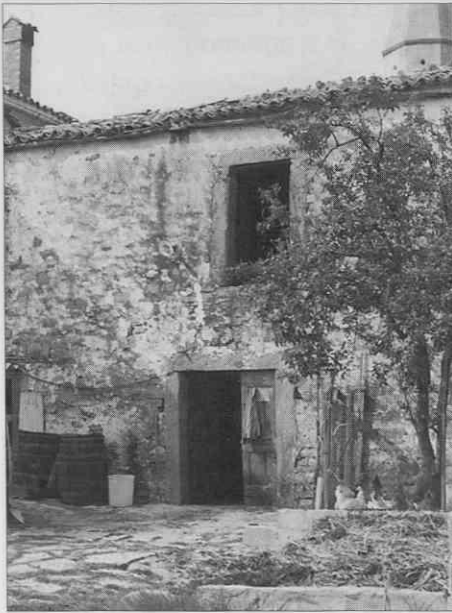
Vrh nad Buzetom; hiša, kjer so Šavrinke spale. ♦ Vrh near Buzet; the house in which the Šavrinke used to sleep ♦ Cime au-dessus de Buzet; maison, où les "Šavrinke" passaient leurs nuits.

isti uri v vas. Si šel kamor te je čakalo. Tudi če so dali kšni drugi, je zmeraj čakalo tudi mene. So dali lahko vsaki pol, ma je čakalo (Gračišče). Je čakalo mene vsaki teden. Enkrat so šle tukaj ene, pred polnočjo so šle, da ki bojo ble pred mano, mi bojo pobrale jajca. Ma niso pobrale. So čakale vse mene. Ja, pa ste mogla jemati tudi krjancu z ljudmi. Mi smo dale takšen košček žajfe (za pol prsta), k je koštav dvejset al petindvejset čentežimov in pole ženske ne bi ble dale drugim, ku ne je čakalo mene vse (Kubed). Jajčarice so bile v hrvaški Istri lepo sprejete, saj je ena revščina podpirala drugo. Dali so jim hrano in prenočišče, one pa so jim jajca plačale z denarjem ali pa so jim iz Trsta prinesle, kar so naročili: sukanec za se krpato, žajfo, katon (bombažno blago), štrene za plest (volna), petrolej, gumbe, igle, riž, sladkor... Ker je bila revščina v osrednji Istri še večja, so jim včasih pustile kakšno stvar tudi na kredenco (na up). Ko so zbrale vsa jajca, so jih pri gospodinjini zložile v bisage. Na osla so dale najprej mehko podlago, nato sedlo, nanj pa bisage: "Zvečer smo jajca preštrevale: z desnico po tri z levico po dve... V bisage smo naložile slamo, na dno smo naredile trdo podlago, nato pa zlagale: eno vrsto slame, eno vrsto jajc. Naokoli smo trdo potiskali slamo, da so bila jajca zavarovana pred udarci." (Franca, 1990:4)