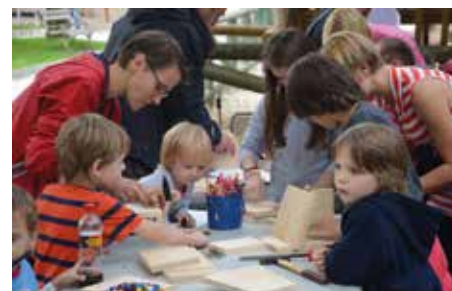
Izdelovanje netopirnic v ZOO Ljubljana.