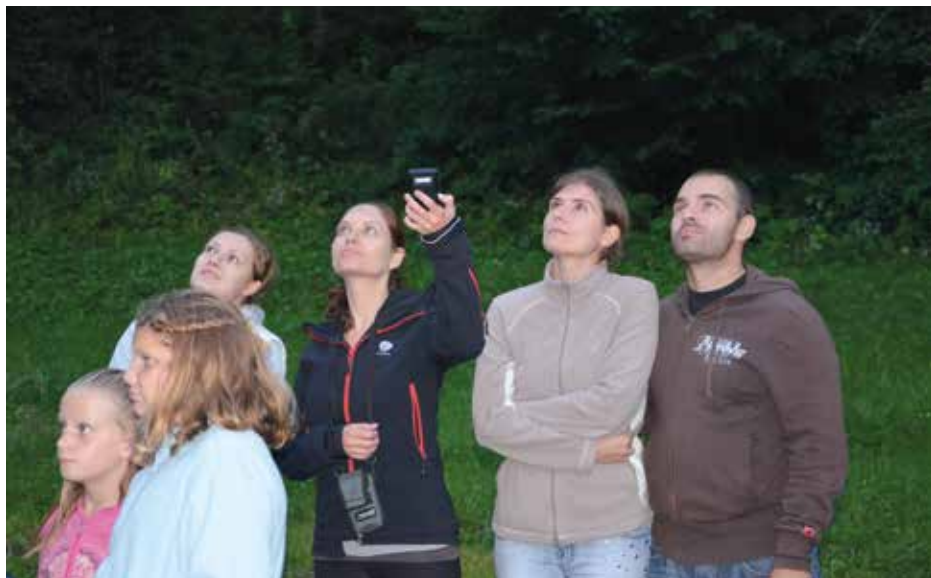
Opazovanje netopirjev pri cerkvi sv. Janeza Krstnika v Podkraju.

šestih predavanjih oz. predstavitev, na enem dogodku pa smo govorili o negativnem vplivu svetlobnega onesnaženja na netopirje in druge živali. Netopirje smo na petih dogodkih lahko celo opazovali v naravi. V večernem času smo netopirje spremljali, kako izletavajo iz dnevnih zatočišč – cerkva ali jam –, oz. poslušali njihove visokofrekvenčne kliče preko detektorjev. To je obiskovalce naših dogodkov, še posebej otroke, najbolj navdušilo. Izvedli smo tudi dve čistilni akciji odstranjevanja gvana in dve delavnici: izdelovanje lesenih netopirnic in ustvarjanje netopirjev iz papirja. Tako je netopirje kot zanimiva in prav nič strašna bitja na Mednarodni noči netopirjev 2014 spoznalo vsaj 320 ljudi. Vse, ki vas zanima skrivnostni svet živali, pa že danes lepo vabimo na 17. Mednarodno noč netopirjev konec avgusta in v septembru 2015! ✨