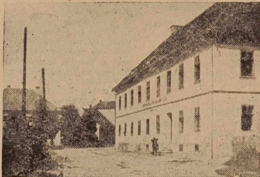
Taka je šola v Križevcih pri Ljutomeru; tesna, na neprimernem prostoru in še kaj; zato ni čudno, če si želijo ljudje v Križevcih novo, prostorno moderno šolsko poslopje

Preveč bi moral napisati, če bi se hotel dotakniti vsega.