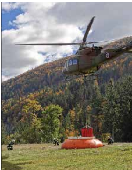
Helikopter Slovenske vojske je pomagal pri vaji gašenja požara na Tomanovi planini.