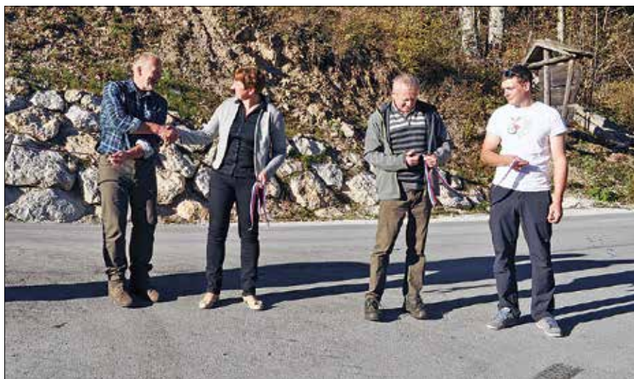
V Robanovem Kotu so namenu predali prenovljeno cesto in parkirišče.