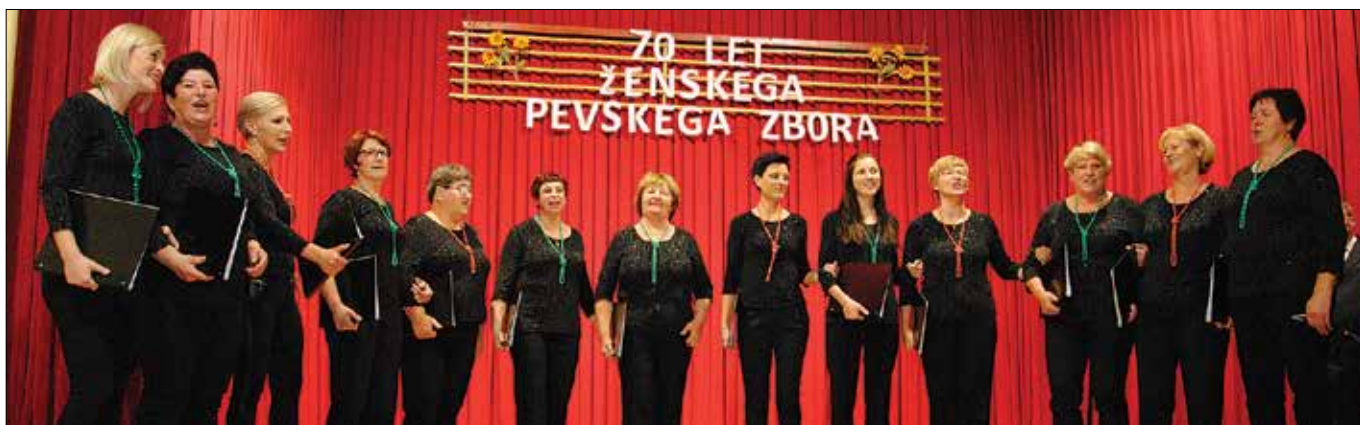
Pevke so poskrbele za prešerno vzdušje tako na odru kot v dvorani.