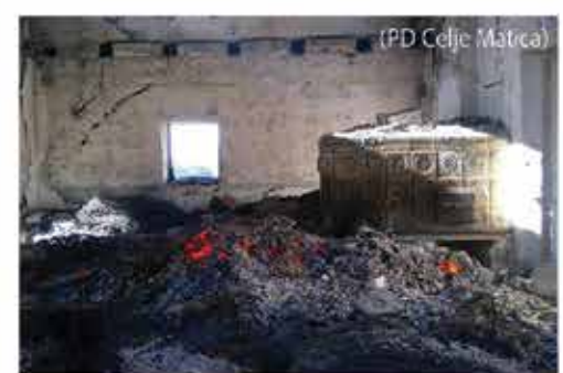
Ognjeni zubli uničili Kocbekov dom na Korošici