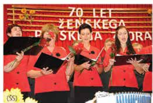
70 let Ženskega pevskega zboru Bočna