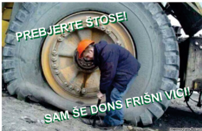
To sm jes in ...

In smo dočakali drugi krog volitev predsednika države. Res dobra izbira med enim, ki je bil glumač, in drugim, ki je, in še predsednik povrhu.