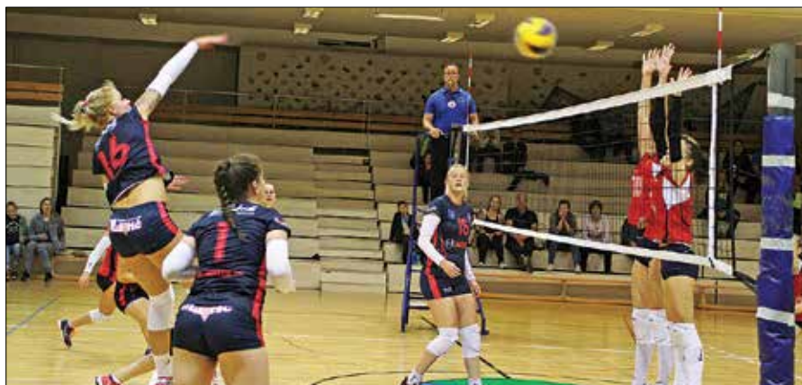
V soboto so Mozirjanke na domačem parketu Športne dvorane Mozirje gostile ekipo Braslovč.