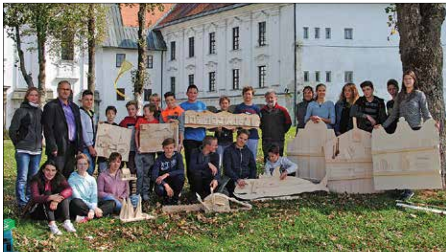
Udeleženci Jamnikove kiparske kolonije z izdelki