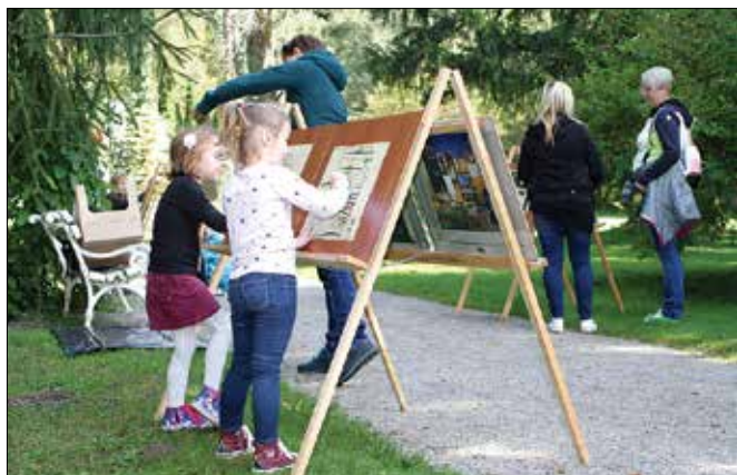
Otroci so se na likovni koloniji v Gaju zbrali že dvanajstič zapored, sodelovalo jih je rekordno število.