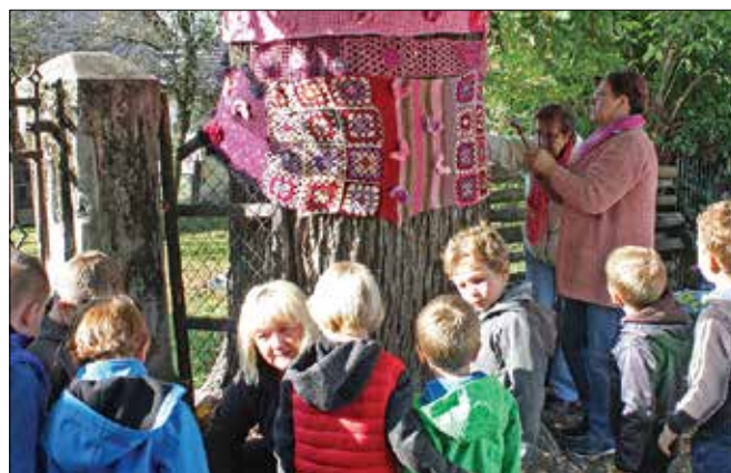
Rečiška trška lipa bo cel mesec nosila rožnato preobleko, ki so jo pripravile vezilje društva upokojencev in malčki iz vrtca.