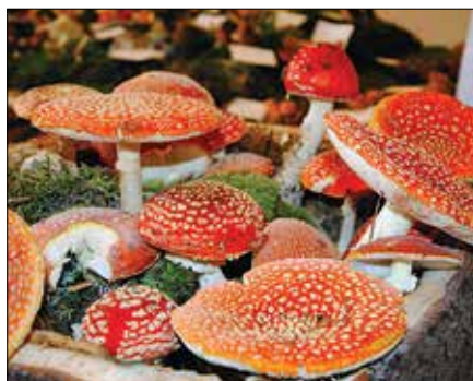
Najbolj izstopale so smrtno nevarne, a lepe na pogled, rdeče mušnice.

Gobarji so priložnost izkoristili za izmenjavo vtisov o gobarski sezoni, obiskovalce so ozaveš-