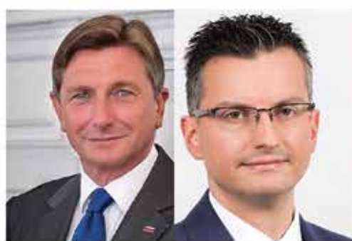
V Zgornji Savinjski dolini Šarec tesno za Pahorjem