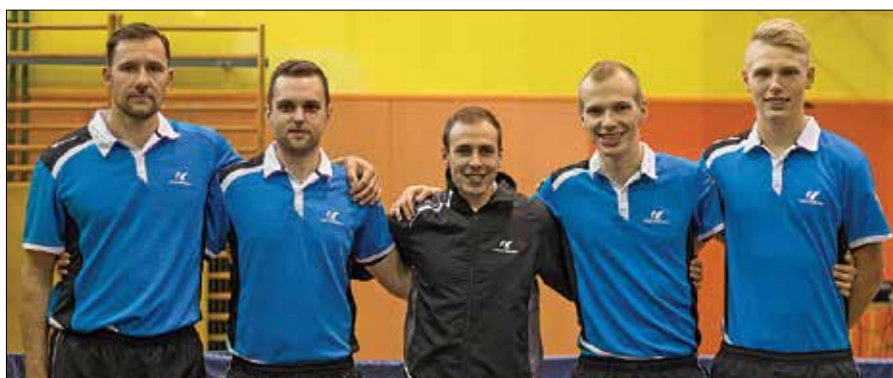
Prvoligaška ekipa NTK Savinja Lean rešitve.

Že to soboto, 28. oktobra, bo ekipa NTK Savinja Lean rešitve zopet odigrala domačo tekmo. Ob 17. uri se bodo v telovadnici lučke osnovne šole pomerili z nasprotniki iz prestolnice ekipo NTD Kajuh Slovan. Domačini obljublajo pestro borbo in vabijo gledalce, da se udeležijo vrhunske namiznoteniške tekme ter z navijanjem pomagajo domačinom do druge zaporedne prvoligaške zmage.