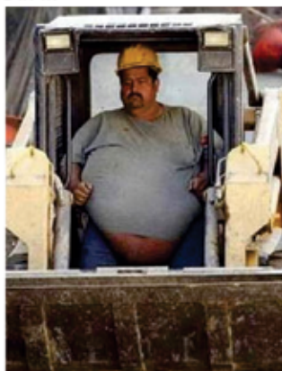
... to je moj šef

Obtoženi: „Prav. Ampak ne se potem žalit, ko bom nasprotnika spet položil po tleh.“