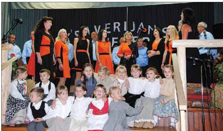
Ksaverjanski večer so nastopajoči zaključili s skupno točko.