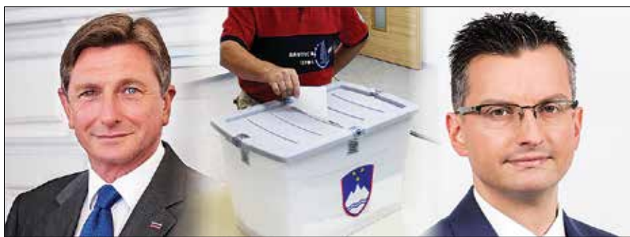
Gledano po posameznih voliščih našega volilnega okraja sta se na prvem mestu izmenjevala Borut Pahor (levo) in Marjan Šarec.