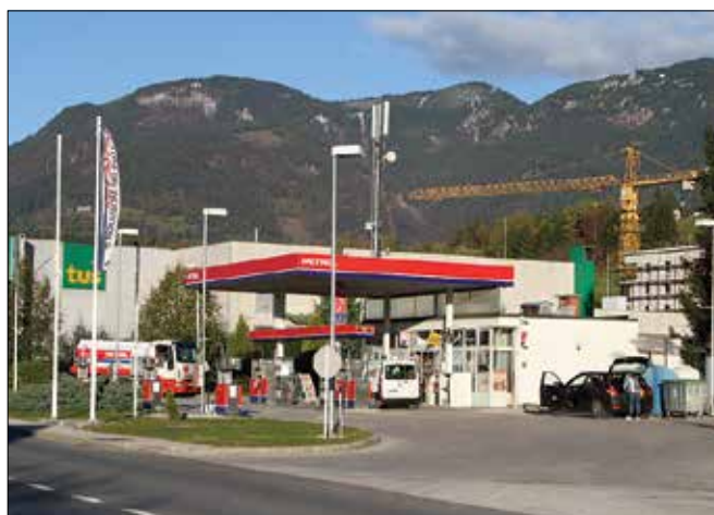
Bencinski servis v Mozirju je dobil srebrno priznanje Turistične zveze Slovenije.

Destinacije Zgornje Savinjske doline se redno pojavljajo v izboru najlepših in med dobitniki priznanj te akcije, ki je bila prvič organizirana že leta 1991. Izletniški kraji, šole, trgi in podobno so na tem območju velikokrat v ožjem izboru za najlepše.