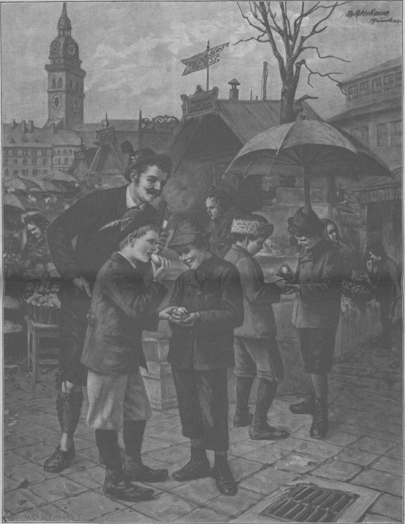
□ □ □ O Veliki noći. □ □ □