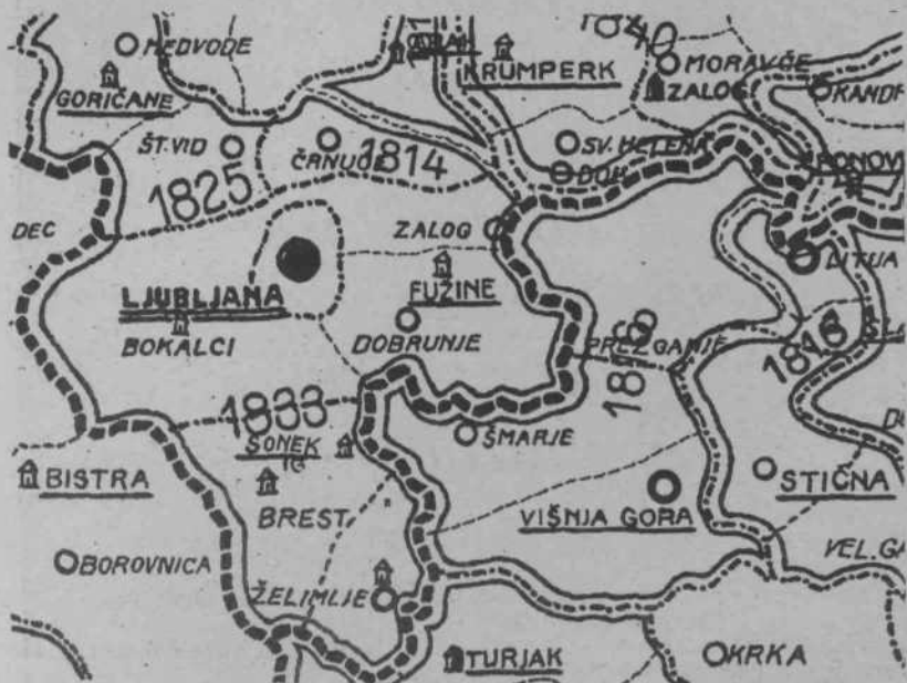
Upravna razdelitev Kranjske med leti 1814–1848