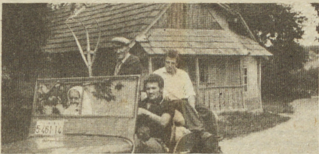
Odkar so v krajevni skupnosti Gorice pri Lendavi asfaltirali poti se vinogradi odprli tudi za turiste...