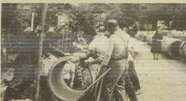
Krajani krajevne skupnosti so lani uredili tudi del kanalizacije da bi si tudi tako olajšali bivalne razmere.