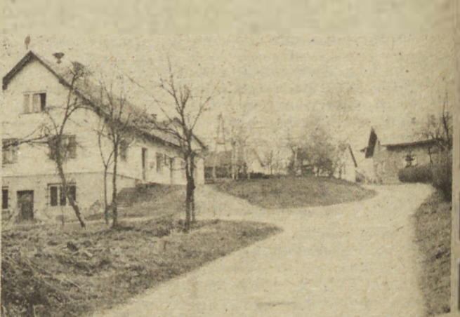
Spodnji in Zgornji Kamenščak nista strnjena naselja. Raztegujeta se po slemenu skoraj 10 kilometrov daleč. Kljub temu pa se hiše strnejo v nekakšne skupine, ki dajejo prijetno, domače in idilično vzdušje.

ka v zadnjih letih doživela precej napredka. Vaščani so s samoprispevkom asfaltirali cesto, ki vodi proti Bučkovcem in naprej proti Ptujju. Skoraj ves Spodnji Kamenščak ima vodovod, ki ga nameravajo v letošnjem letu tudi modernizirati, in sicer s sredstvi, ki jih bodo solidarnostno združevali. Na Zgor-