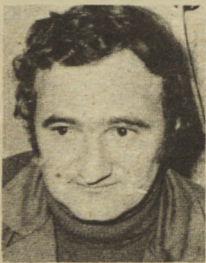
so zaradi zadružnega skladišča in telefonije.