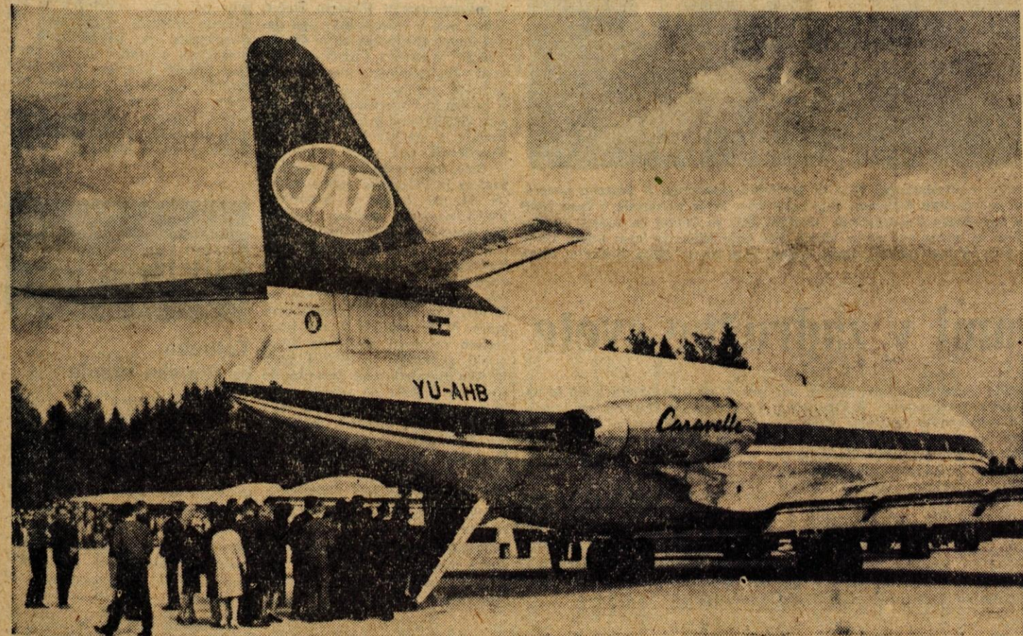
Caravelle Bled ob popoldanskem pristanku na letališču Brnik