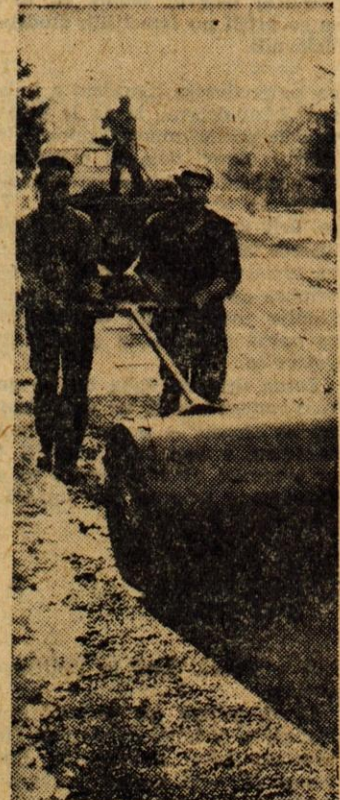
Zima je ceste tako poškodovale, da bo trajalo še precej časa, da bodo poškodbe popravili. Na sliki ena izmed ekip Cestnega podjetja Kranj pri delu

skrbeli so tudi za vzgojo in za strokovno izpopolnjevanje članstva ter izpolnjevanje podčastniške. V prihodnje nameravajo povečati gasilski dom in okrepiti godbo. — J. B.