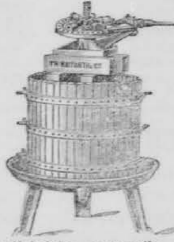
stiskalnica za grozdje.

Izdelujejo in pošiljajo na jamstvo kot posebno najnovjšega izbornega uresničnega, najbolj pripoznanega in odlik. sestava.