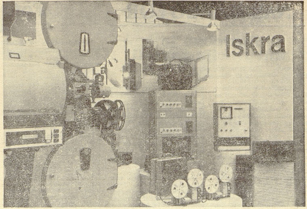
Majhna, toda zelo lepo oblikovana stojnica ISKRE na razstavi foto-kinotehnike v Beogradu