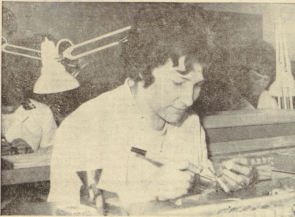
Instrumenti Otoče: v oddelku, ki dela za inozemsko firmo »Bertram« male precizne instrumente, je sedaj 34 pogodbeno zaposlenih. —Vse delavke so bile pred sprejetjem testirane od psihologa ZP