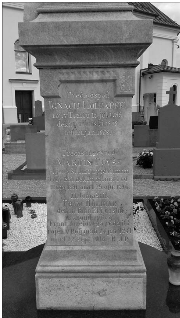
Grob Ignacija Holzapfla v Hrovači.

ni vojni soočal s hudo prostorsko stisko. Ljubljanska gluhoemnica je bila namreč edini tovrstni zavod v slovenskem delu jugoslovanske države. 54