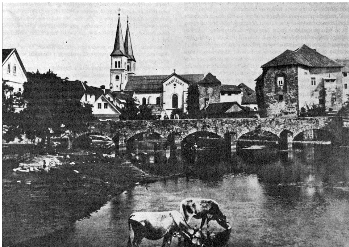
Francoski most, ribniški grad in cerkev, dograjena leta 1868 na temeljih stare (Ribnica skozi stoletja, str. 103).

ki. Ena je bila v gluhonemnici, druga pa v ribniškem župnišču. 36 Po opisu Ribničanov, ki so ga imeli v spominu še iz otroških let, je bil majhne, čokate postave, plešast, trdih obraznih potez in strogega pogleda. 37 Po opisu sodobnikov je bil zelo pameten mož, do sebe strog in odločen, pravičen, iskren in zelo dober do trpečih. 38 V pogled v njegovo osebnost in odnos do župljanov nam izpričujejo cerkvena oznanila, ki jih je sestavljal k svojim pridigam. Kot primer poglejmo oznanilo iz leta 1861 ob škofovem obisku. 39 Približeval se je namreč čas birmе. Holzapfel je župljane podrobno poučil, kako morajo ravnati ob obisku visokega cerkvenega dostojanstvenika in kako se morajo starši in otroci pripraviti na birmo. Staršem je svetoval, naj otroke nanjo pripravijo s pogostimi molitvami in družinskim postom, ne pa z »gizdovimi« oblačili – skratka, brez »posvetne prevzetnosti«, saj »Bog le ponižnim svojo gnado daje«. 40 Prav tako jim je svetoval previdnost pri izbiri botrov. Ti naj bi bili