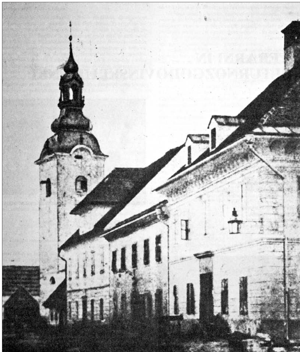
Stara cerkev v Ribnici, ki so jo leta 1866 porušili (Ribnica skozi stoletja, str. 102).