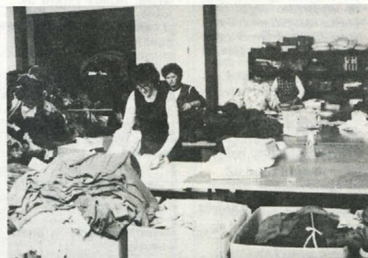
PAKIRANJE — V temeljni organizaciji združenega dela Konfekcija Dobova je v dveh izmenah 166 zaposlenih. Gre za delavke iz bližnjih krajev, nekaj pa jih je zaposlenih tudi s hrvaške strani. Na naši fotografiji so delavke v končni fazi, pri pakiranju.