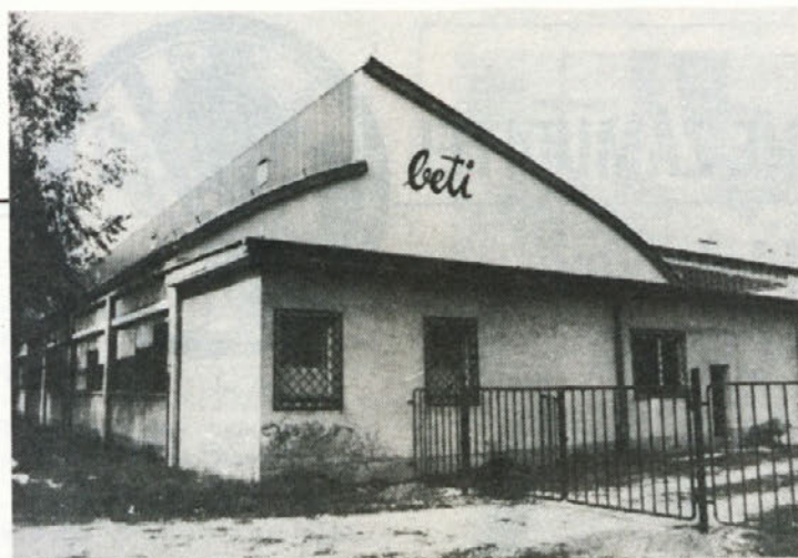
BETI, DOBOVA — Iz naše temeljne organizacije v Beti imamo bolj malo vesti, pa čeprav zato veliko več obljub, da bomo dobili kakšno poročilo. Zato se tokrat zadovoljimo s tremi fotografijami. Na sliki: hala s površino 750 kvadratnih metrov, ki smo jo zgradili 1973. leta.

Prav tam, stran 302: »Na svidenje, dragi!« je rekla.