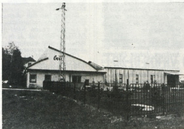
NOVA PRIDOBITEV — Da se tudi v doboviškem tozdu razmere spreminjajo, dokazuje druga fotografija, na kateri je pridobitev iz lanskega leta. Gre za 400 kvadratnih metrov novih proizvodnih površin. Za tiste, ki v Dobovi še niste bili, povejmo, da je nova hala na desni strani.