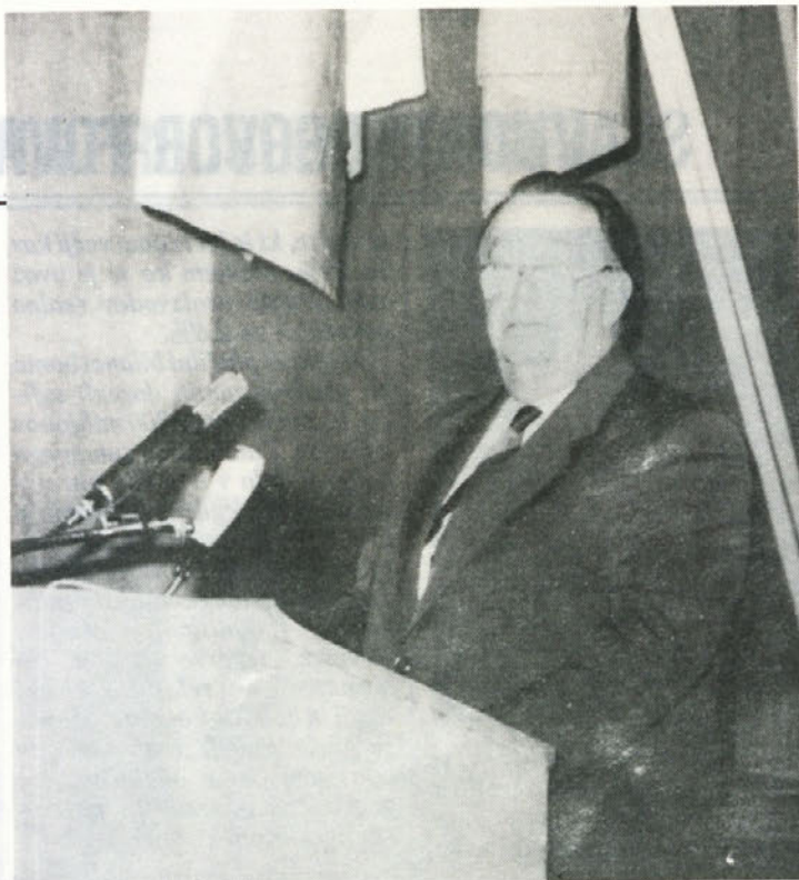
Slavnostni govornik na slavnostni seji delavskega sveta DO Beti ob praznovanju tridesetletnice je bil tovariš Stane Dolanc, član predsedstva SFRJ. Njegov govor je v celoti objavljen v tej številki Vezila.

Ob tej priložnosti bi rad poudaril nekaj značilnosti v razvojni