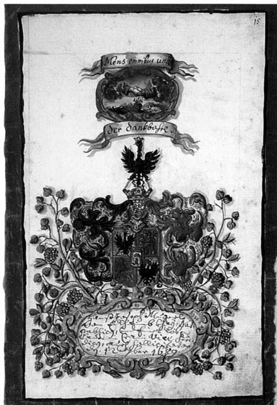
1. Spominska miniatura Janeza Jožefa Mugerla pl. Edelhaimba v Spominski knjigi ljubljanske plemiške družbe sv. Dizma , fol. 37r, fig. 15.

uradnika, hkrati pa za pobožnega vernika in velikega dobrotnika, saj se je z 2000 goldinarjev vredno glavnico med prvimi zavzel za ustanovitev sirotišnice in daroval glavnico 1000 goldinarjev za uboge. 8