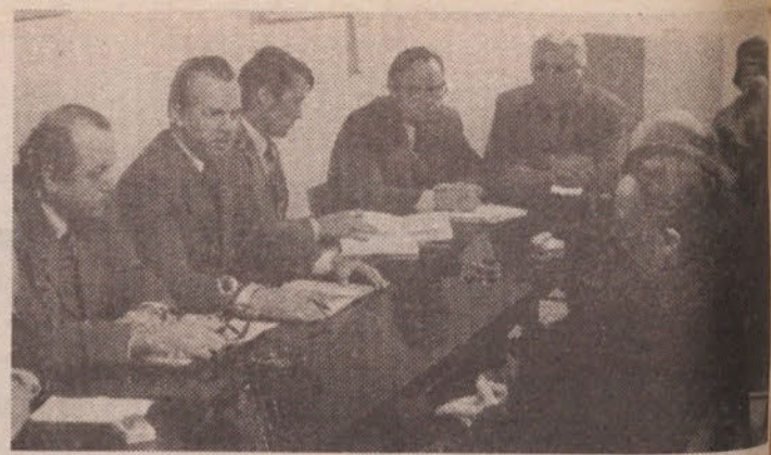
S posveta v KS Trnovo