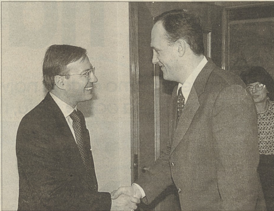
Predsednik Državnega zbora Podobnik pozdravlja predsednika SVP Bruggerja

S tem srečanjem se je končal dvodnevni obisk visoke delegacije južnotirolske ljudske stranke, ki sta ga organizirala Center avstrijskih narodnosti z Dunaja in Slovenska skupnost.