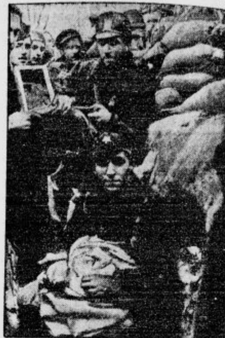
Rdeči španski vojaki imajo na svojih uniformah sovjetske ruske znake.