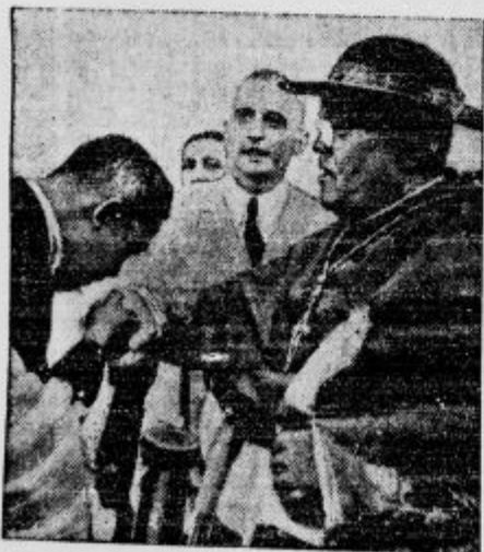
Zupan mesta Manila pozdravlja zastopnika svetega očeta, ki je vodil svetovni euharistični kongres v glavnem mestu Filipinske države.

s Po misijonskem svetu. Irška je poslala od novembra 1935 do novembra 1936 v misijone 80 duhovnikov, 12 misijonskih bratov in 82 sester. Kako daleč smo v tem pogledu za Irsko katoliški Slovenci! — 8 novih duhovnikov domačinov je bilo pred kratkim posvečenih v afriški Ugandi. Zdaj deluje tam 58 belih očetov in 43 domačih duhovnikov. — Laskavo pohvalo je izrekel o katoliških šolah v Afriki angleški