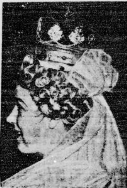
Takele frizure bodo nosile gospe, ki bodo povabljene na kraljevo kronanje v London.

Po vojni je ta občina dosledno z večino glasov volila proti skupni fronti slovenskega ljudstva. Nekaj let je imelo radičevstvo v Vitanju močno oporo. Večina ljudi je gospodarsko zelo odvisna in jim razni kruhodajalci narekujejo tudi politično mišljenje in prepričanje. Tajne volitve bi v taki občini, kakor je Vitanje, za JRZ brez dvoma mnogo bolje izpadle. — Na to je »Slovenec« »Jutro« odgovorilo takole: »Da bi omilil in zabrisal vtis, ki ga je povsod naredil izid nedeljskih občinskih volitev v Vitanju, je »Slovenec« po volitvah napisal, da je bilo Vitanje ukadaj ena najtrdnjših postojank nemštva in nem-