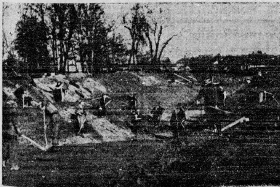
Kako skrbi Ljubljana za svoje reveže. Namesto podpor v denarju, ki so marsikdaj zgrešile svoj cilj, daje magistrat ljudem priliko, da si nekaj zaslužijo s delom. Na sliki vidimo, kako brezposelni regulirajo strugo Gradašnice

d Isurjeni tihotapei. Na najrazličnejše načine utihotaplajo iz Avstrije k nam razne reči, zlasti saharin. Saharin spravljajo čez mejo celo v kosteh. Podoželan pride s prav nedolžnim obrazom do obmejnih organov ter prijavi nekaj kilogramov mesa ter tarnanjem nad slabimi časi plača odgovarjajočo carino. Komaj pa zapusti carinsko stražnico, je nje-govega tarnanja in otožnosti konec. Zaveda se, da je spravil obenem z mesom v kosteh čez mejo tudi lepo količino saharina in da bo izkupiček za saharin bogato nadoknadil tisto carino, ki jo je plačal za meso. Najlažje tihotapijo dvolastniki, to so posestniki, ki imajo del posestva v Avstriji, del pa v Jugoslaviji. Kdo bi na primer pregledal kos za kosom vsa