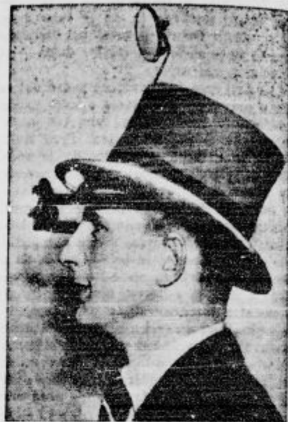
Da bodo lahko gledali svečanosti kralj. kronani tudi v zadnjih vrstah, so začeli v Londonu pripraviti posebne priprave, ki se pritrjujejo kar na cilindar.

čurstva na slovenski zemlji. To je res in tega nihče ne zanika, kolikor se tiče trga samega. Ni pa resnična trditve, da bi trška občina po vojni dosledno volila proti skupni slovenski fronti. Po vojni trg Vitanje ni bil