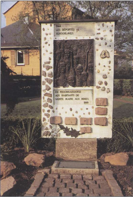
Slika 2: Spomenik »jugoslovanskim« deportirancem v Saint Marie aux Mines.