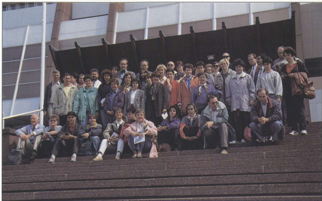
Slika 4: Udeleženci kranjske ekskurzije pred Evropskim parlamentom v Strasbourgu.

ši ogled Padove in Verone ter morenske pokrajine vzhodno in južno od Gardskega jezera. Posebej poučen je bil obisk spominskega parka pri S. Martino della Battaglia, kjer je bila leta 1859 pri bližnjem Solferinu znamenita bitka med Francozi in Avstrijci, pomembna za italijanski »Risorgimento« ali združitev Italije, ter za ustanovitev Rdečega križa. S 65 m visokega spominskega stolpa je mogoče pregledati vso bližnjo in daljno okolico južno od Gardskega jezera, značilno po številnih podolgovatih čelnih morenskih nasipih, ki jih je zapustil adiški ledenik. Prvi dan se je končal v Roveretu po dolgotrajni vožnji ob zahodni obali Gardskega jezera. Naslednji dan je bil posvečen italijanskim Dolomitom z začetkom v Val Cembra, severovzhodno od Trenta. To območje je znano po rdečkastemu bozenskemu porfirju, ki prevladuje na obsežnem ozemlju srednjega Poadižja vse do obrobja Dolomitov. Uporaben je zlasti v cestnem gradbeništvu in nekoč smo te porfirske plošče uporabljali tudi za tlakovanje pločnikov v Ljubljani. Segonzano in njegove zanimive zemeljske piramide so bile naslednji cilj, saj jih je na območju Alp težko videti. Morda o tem zanimivem denudacijskem pojavu več kdaj prihodnjič. V tej zvezi