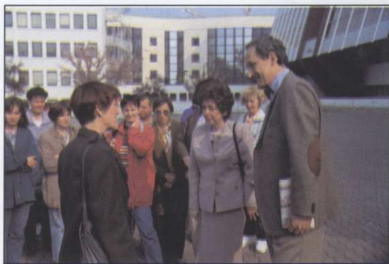
Slika 5: Srečanje udeležencev kranjske ekskurzije s slovenskima predstavnikoma v Evropskem parlamentu veleposlanico Majdo Tovornikovo in gospodom Pogačnikom.

je potrebna omemba, da vse do dneva pred obiskom ni bilo mogoče dobiti zanesljivih podatkov o dostopnosti, ker se verjetno nismo obrnili na pravi naslov. Danes je to najbolje prepustiti turistični agenciji, ki najbolje zna ali bi morala znati poiskati pravo pot do informacij, čeprav ne brez sodelo vanja vodstva ekskur-