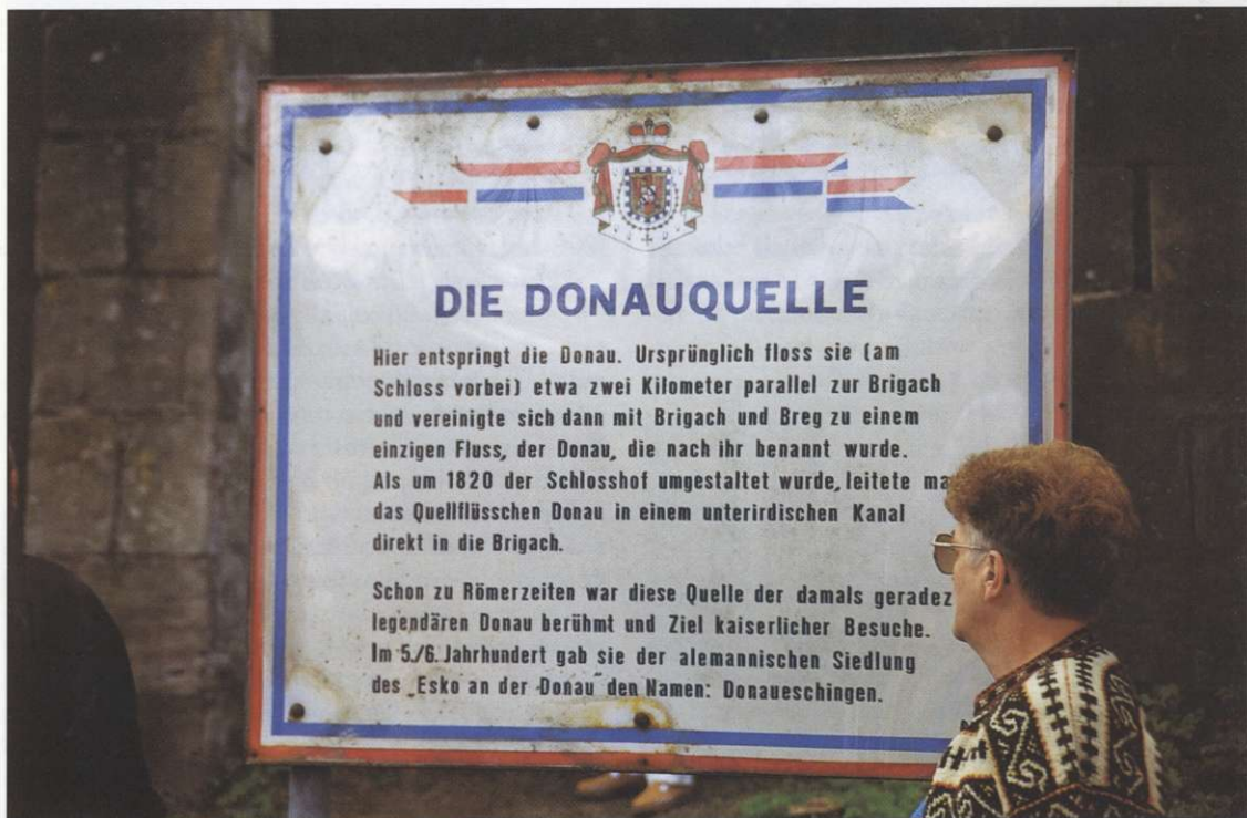
Slika 1: Razlaga pri izviru Donave v Donaueschingenu, iz katere vzemo, da je bilo na izviru Donave alemansko naselje Esko že v 6. stoletju.

Alp za učitelje geografije. Na Oddelku za geografijo Filozofske fakultete smo za študente geografije leto dni pozneje organizirali podobno ekskurzijo po deloma isti, le deloma spremenjeni poti. V tem pris-