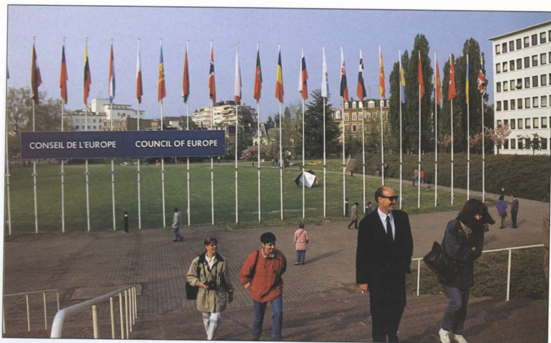
Slika 6: Slovenska zastava (desno poleg slovaške) visi pred Evropskim parlamentom od včlanitve leta 1993.