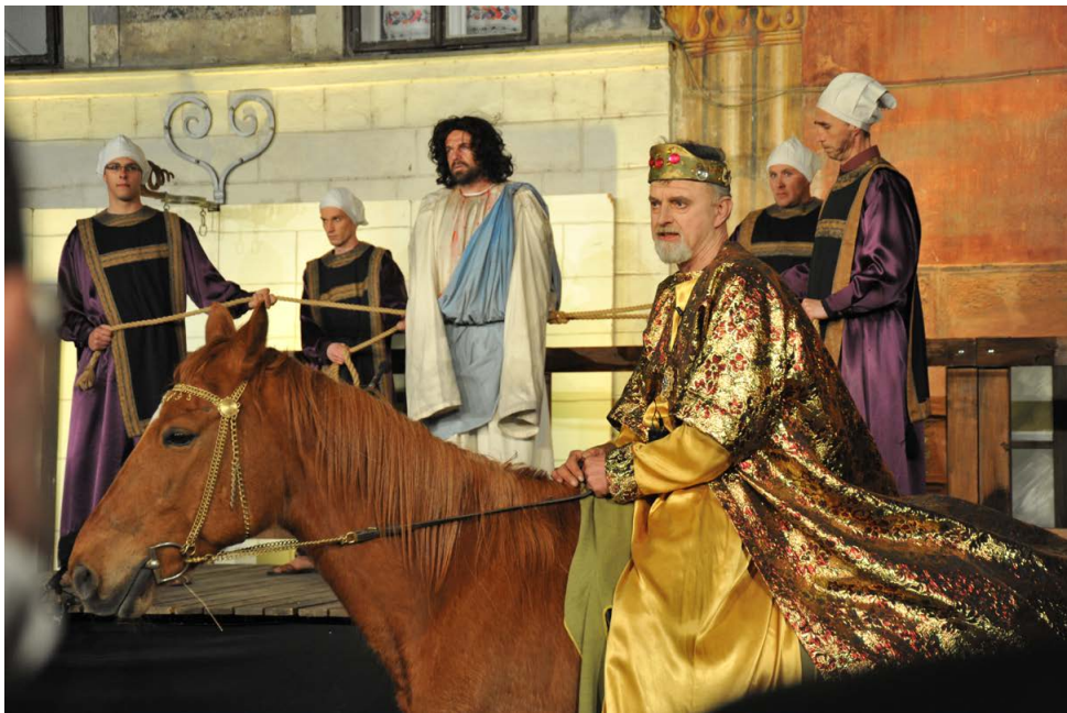
Utrinek z uprizoritve Škofjeloškega pasijona. Foto Anja Jerin, 2015.

pri organizaciji pasijona. Ti svoj prosti čas 22 namenjajo prostovoljnemu delu in druženju ob snovanju načrtov prihodnjih uprizoritev, njihov trud je ob izvedbah pasijona poplačan le z moralnim zadovoljstvom.