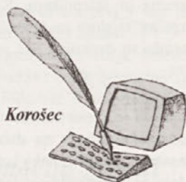
Risba: Tamara Korošec