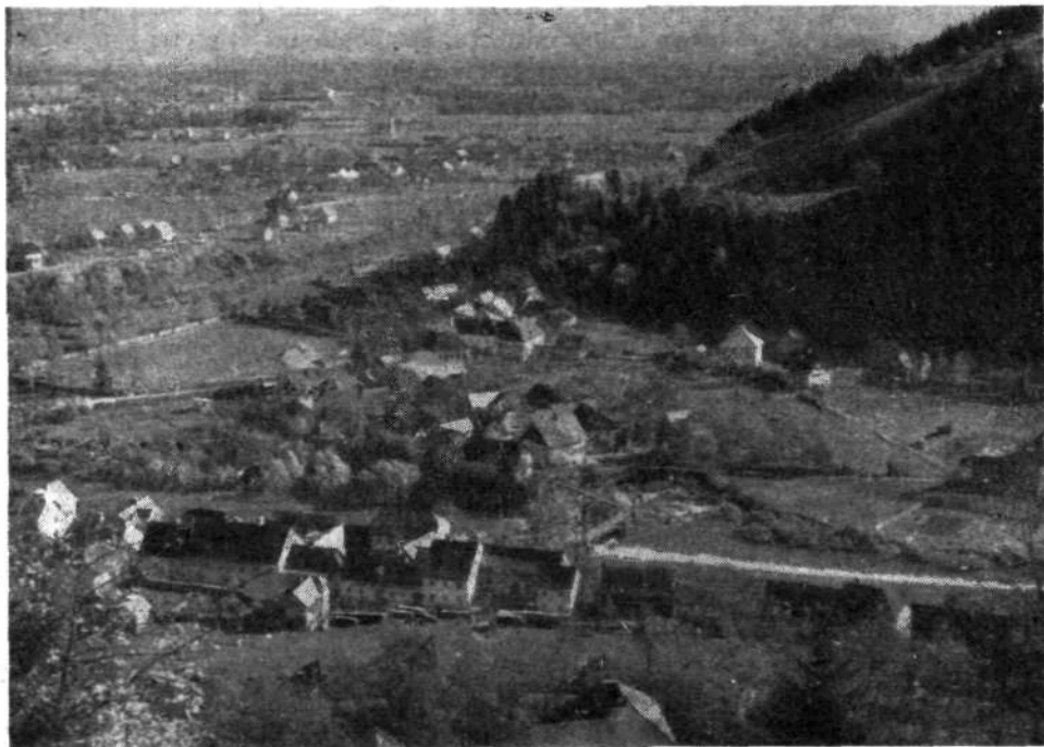
Pogled na spomeniškovarstveno zaščiteno jedro Puštala s Hribeem. V ozadju Suha in Sorško polje.

Najdragocenejši loški spomenik je vsekakor grad, ki je bil dolga stoletja sedež gospostva in po svojem položaju še danes dominira nad mestom in pokrajino. Ko so ga po letu 1890 kupile uršulinke, so žal v marsičem zmanjšale njegovo zgodovinsko vrednost. Porušile so znameniti stolp sredi dvorišča, nadomestile lesene hodnike z nestilnimi zidanimi, sezidale dvorano namesto gospodarskega poslopja in prekrile stari vodnjak na vrtu, ki so ga