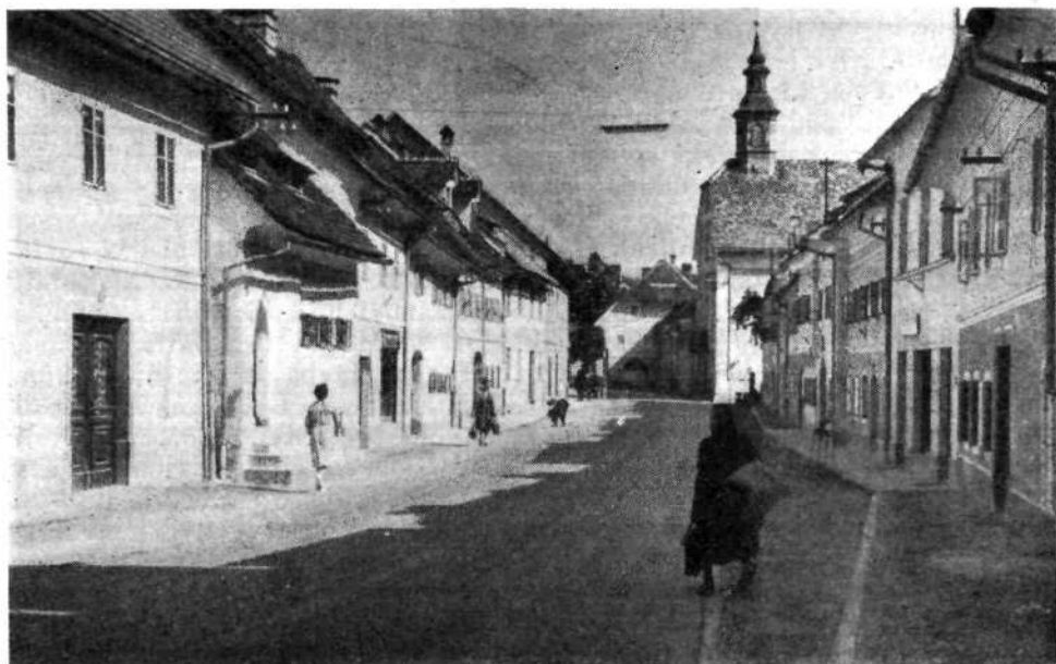
Južni del Spodnjega trga (Lontrga) v Skofji Loki z vrstama živo pobarvanih enonadstropnih hiš, vmes pritična Grohčeva hiša, Spitalsko cerkvi in Petrcovo hišo v ozadju, ki zapira ta del trga.

Čeprav je sedaj okrog starega mestnega jedra že natresenih in razmetanih mnogo nestilnih hiš in hišic, novih blokov in prezidanih ter dozidanih stavb, je stari del mesta vendar še krepek urbanistični individuuum z nadvse harmonično silhueto, z značilnimi ulicami in trgi in z mnogimi svojskimi hišnimi pročelji ter z zanimivo notranjščino stavb. Naloga spomeniškega varstva je, da vse to ohranjuje v izvornih oblikah. Novoizvoljena občinska skupščina je na svoji prvi delovni seji sprejela odlok o »ambient-