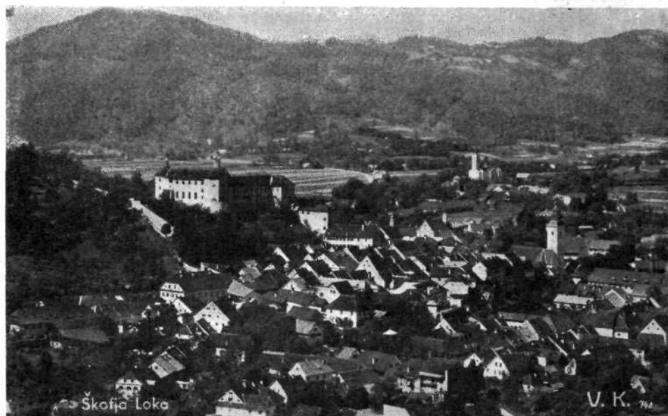
Pogled na spomeniškovarstveno zaščiteni jedri Skofje Loke in Stare Loke s Križno goro v ozadju. (Fototeka Loškega muzeja.)

jugoslovanskih znamenitosti za ogled turistom, ki prihajajo čez mejo. Celje poudarja svoj Stari grad in Grofijo, Ptuj razkazuje rimske starine in grajsko kulturo, Ajdovščina opozarja na stare utrdbe. Pri Lukovici obujajo spomine na rokovnjače, v Litiji prirejajo pustni festival, v Ljubnem flosarski, v Bohinju kravji, na Jezerskem ovčji bal itd. Ribnica ima vsako leto svoj festival s kulturnoprosvetnim in športnim programom, vsako peto leto pa s posebno razstavo pokaže napredek svojega gospodarstva. Skoro ni pomembnega kraja v Sloveniji, kjer bi ne bilo opaziti prizadevanj za ohr-