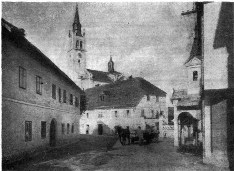
Motiv iz Stare Loke (Fare) s Primčevo in Mruškovo domačijo ter s cerkvijo, ki spada med slovenske prafare.

Na Lontrgu so vredne posebnega varstva Kašča, Klopčarjeva hiša z edinimi starimi štacunskimi vrati na koleno, Špital in špitalska cerkev, Dom DPD Svobode, Grohcova in Krennerjeva hiša ter lipa. Kaščo in prostor okrog nje ureja tovarna Šešir, ki jo uporablja za skladišče dlake. Ta znamenita stavba mora stati popolnoma ločeno, da bo prišla njena starinska arhitektura prav do veljave. Z njene zunanjsčine je treba odstraniti vse mlajše