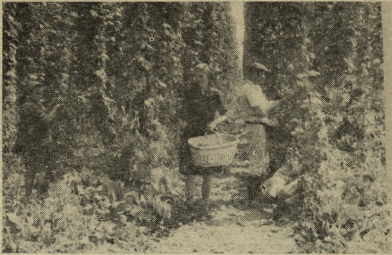
Še par dni nas loči od trenutka, ko se bomo vsi zažrli v polna hmeljišča

Morebitne nezgode prijavite na poslovne enote, kjer imajo potrebne obrazce.