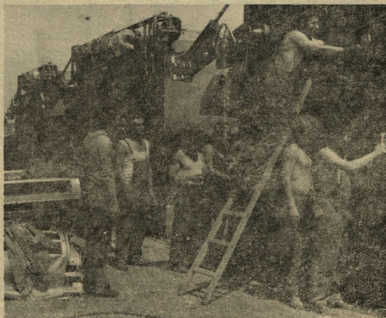
V Strojni Žalec končujejo montažo 22 obiralnih strojev za hmelj