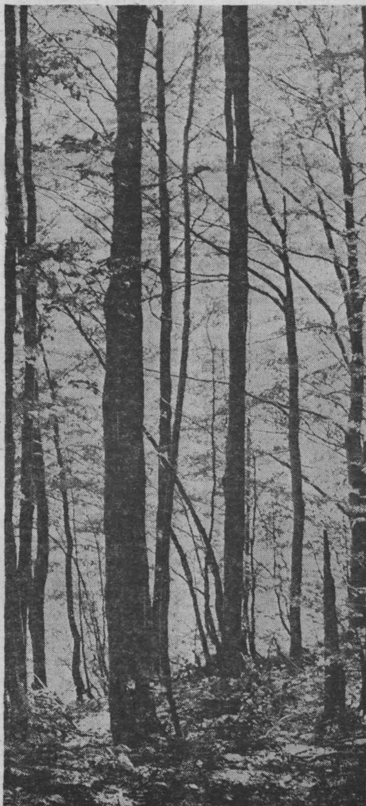
Pomladni gozd že vabi sprehajalce. Hoja po gozdu je, posebno za starejše ljudi, odlična rekreacija.