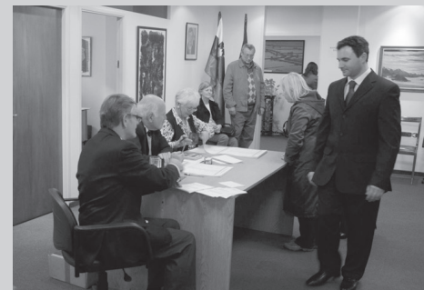
Volišče na veleposlaništvu RS v Buenos Airesu

Kar se tiče glasovanja po pošti, je kar nekaj rojakov zahtevalo volilno gradivo, ki pa ni bilo dostavljeno v redu oziroma pravočasno. Marsikateri ga sploh ni prejel in bil tako prikrajšan za možnost, da odda svoj glas.