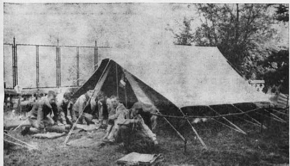
Vod panterjev čisti šotor