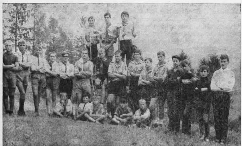
Skavtska skupina ob jamboru za slovo