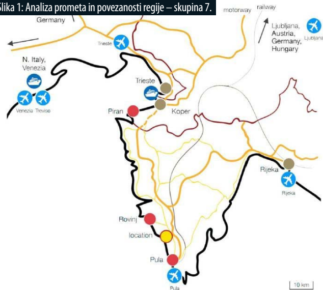
Slika 1: Analiza prometa in povezanosti regije – skupina 7.