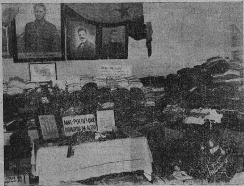
Razstava nabranega blaga, od strani Ž. O. U. S. J. in Ljudskega Odra. Razstava je bila v prostorih Lj. Odra.

V imenu našega stradajočega naroda najiskrenejša zahvala vsem onim, ki so se udeležili te prireditve.