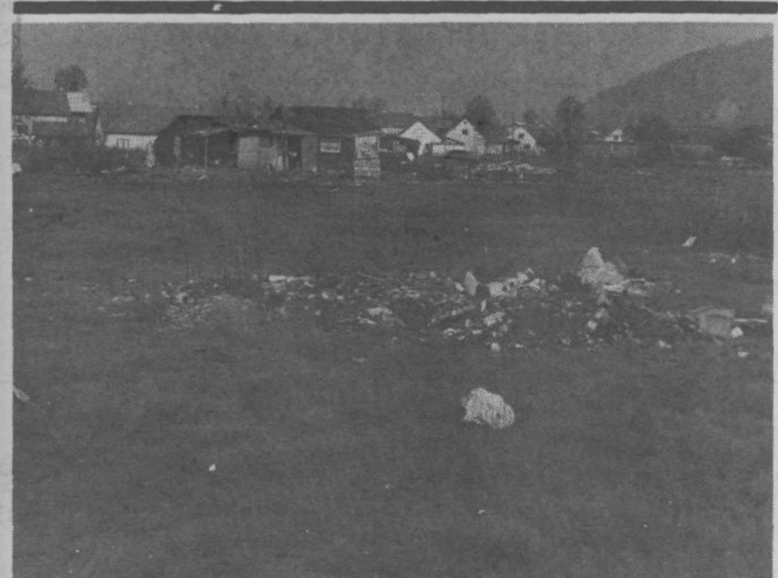
Ljubljana in njena okolica že postopoma postaja eno samo smetišče. Tudi v občini Moste-Polje imamo dovolj divjih odlagališč smeti, kot je denimo tole v Zg. Kašlju. Sodimo, da bi morale pristojne inšpekcije temeljito „prečesati“ teren in ostreje ukrepati