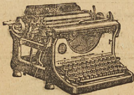
Telefon 268 Ustanovljeno leta 1906.

Instalacija vodovodov, kleparstvo, krovstvo. Industrija pločevinastih in litografiranih ambalaž.