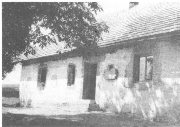
Hiša na Toškem čelu št. 8, kjer je jeseni 1942. leta bival in deloval centralni komite KP Slovenije

Po arhivskem gradivu pripravila Mojca Černe