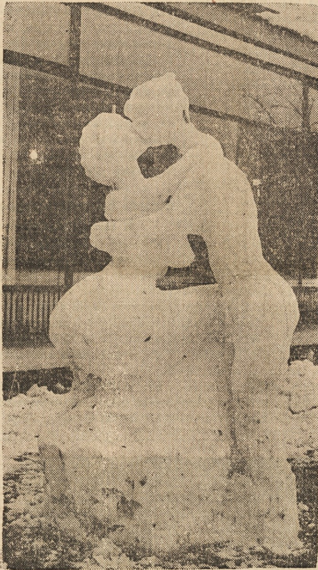
SONCE JU BO UNICILO — V Berlinu so izdelali iz snega par mladih zaljubljenec. Vroča ljubezen in — sonce ju bosta prezgodaj uničila.