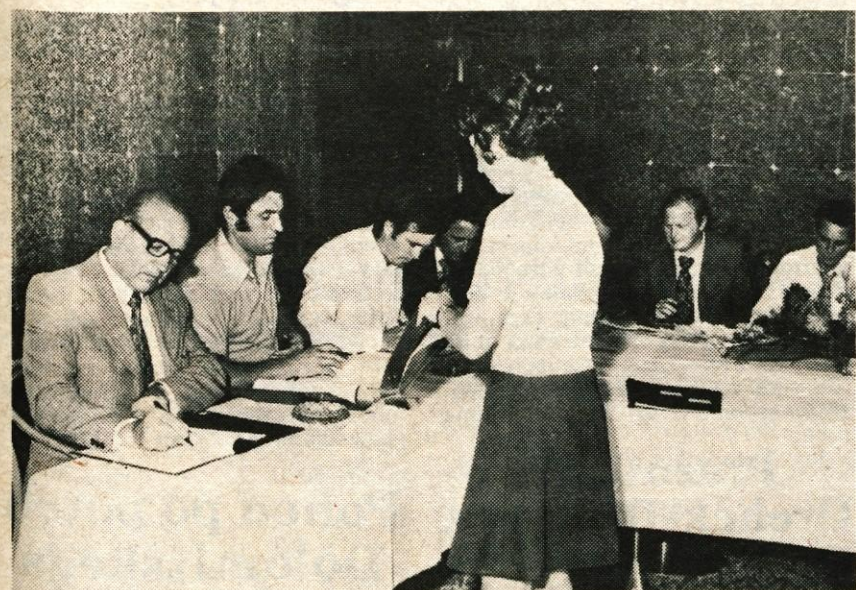
Prerastavniki proizvajalcev kmetijskih strojev iz Slovenije (Creina Kranj, Krasmetal Sežana, Metalna Maribor, SIP Sempeter, Tehnostroj Ljutomer, Železarna Štore in Hmezad Zalec) so v petek popoldne v hotelu Creina v Kranju podpisali samoupravni sporazum o združitvi omenjenih delovnih organizacij v sestavljeno organizacijo združenega dela Združena industrija kmetijskih strojev in opreme. Slovesnega podpisa samoupravnega sporazuma so se udeležili tudi predstavniki občinskih skupščin kjer je sedež podjetij, predstavniki republiške gospodarske zbornice in drugi. — A. Ž.

Druga, že nekoliko starejša pobuda, pa je iz osnovne šole v Gorenji vasi. Letos se bo začelo že tretje šolsko leto, ki staršem ne prinaša skrbi, kje kupiti šolske knjige. V šoli so namreč uvedli zamenjavo šolskih knjig. Učenci konec šolskega leta oddajo svoje knjige in že takoj prejmejo druge — sicer rabljene — za višji razred. Zamenjave šolskih knjig so bile letos nekaj povsem običajnega in z vseh šolah v škofjelški občini in nekaterih šolah v radovljiški in kranjski občini. Vendar ta zamenjava, ki so jo podprle tudi temeljne izobraževalne skupnosti in zavod za šolstvo v Kranju, še nima takšnega obsega, kot bi si ga zaslužila. O njej naj bi več razmišljali v novem šolskem letu. L. Bogataj