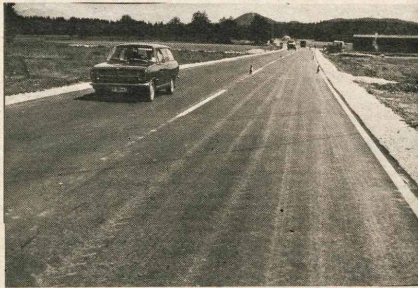
Prenovljen odsek ceste Reteče—Jeprca je že odprt za ves promet. Delavci Cestnega podjetja iz Kranja so položili asfalt na dolžini približno 800 metrov ter širini 7,70 metra. Na obeh straneh pa so uredili bankine v širini 1 metra.