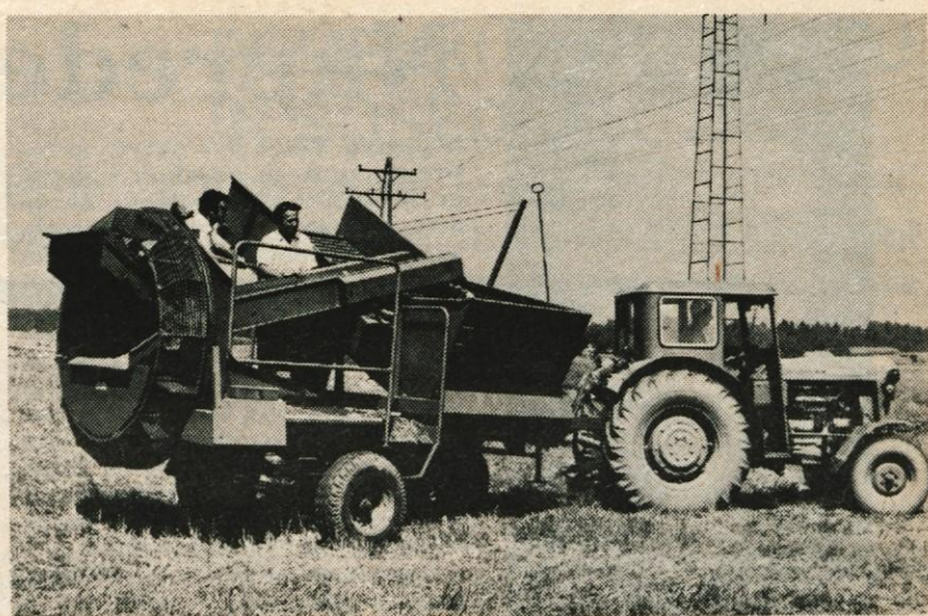
Kmetijsko živilski kombinat Kranj, TOZD Komercialni servis — enota Agromehanika, ki je letos na mednarodnem Gorenjskem sejmu razstavljal in prodajal različne kmetijske stroje, je v nedeljo dopoldne pripravil tudi demonstracijo s kombajni za krompir. Različne kombajne za krompir si je na zemljišču KŽK na Zlatem polju ogledalo precej kmetovalcev. — A. Ž.

Direkcija tudi obračunava premijo za mlado pitano živino v višini 1,50 dinarja za kilogram žive teže kot je to določeno v zveznem odloku. Premije bodo plačali tudi za že odkupljeno živino vsem organizacijam in kmetom z urejeno dokumentacijo. Premijo direkcija izplačuje prek živinorejske poslovne skupnosti. -lb