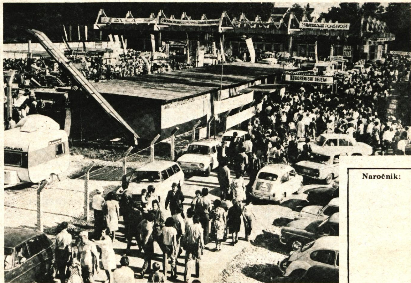
V Kranju so sinoči zaprli XXIV. mednarodni Gorenjski sejem, na katerem je 11 dni 280 razstavljalcev, od tega 80 iz 11 tujih držav, razstavljalo in prodajalo pohištvo, gospodinske stroje, tehnične predmete, tekstil, razne obdelovalne in kmetijske stroje, gradbeni material, motorna vozila in drugo blago. Zanimanje za letošnji sejemski prireditelj je bilo veliko doma in v tujini. Sejem si je ogledalo okrog 150.000 obiskovalcev, razstavljalci pa so po nepopolnih podatkih zabeležili za okrog 110 milijonov novih dinarjev prometa. Največji obisk so na sejmju zabeležili v četrtek, ko si ga je ogledalo okrog 20.000 obiskovalcev. Obisk na sejmju bi bil najbrž še večji, če v zadnjih dneh ne bi bilo tako vroče. — A. Ž.