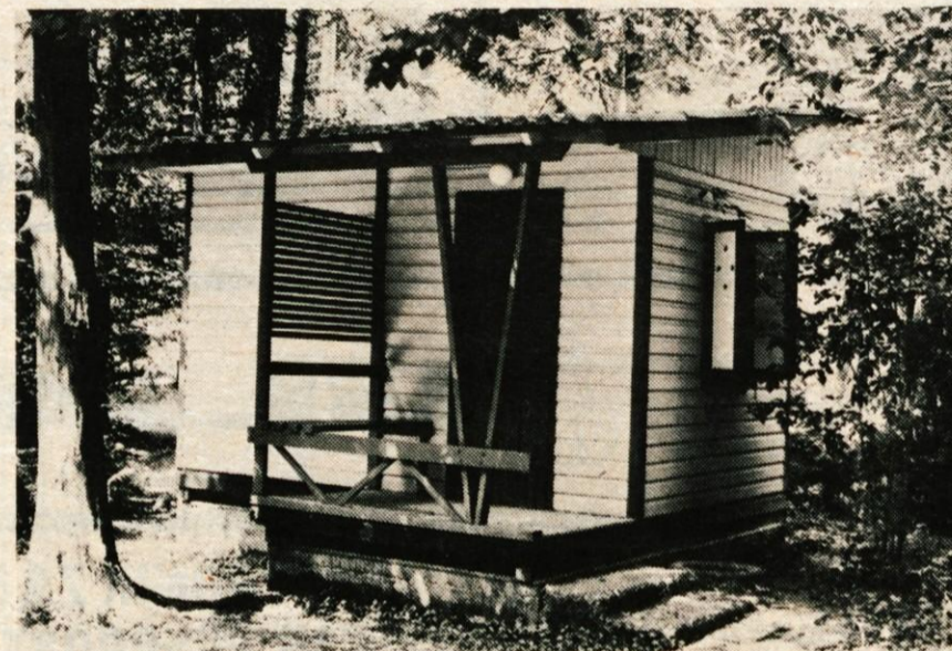
Prijetne počitniške hišice so postavljene med drevjem nad kopalniščem ob reki Sori.

Kokra v avgustu — Kokra v avgustu — Kokra v avgustu