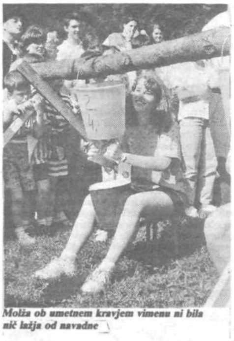
Molja ob umetnem kravjem vimezu ni bila nič lažja od navadne