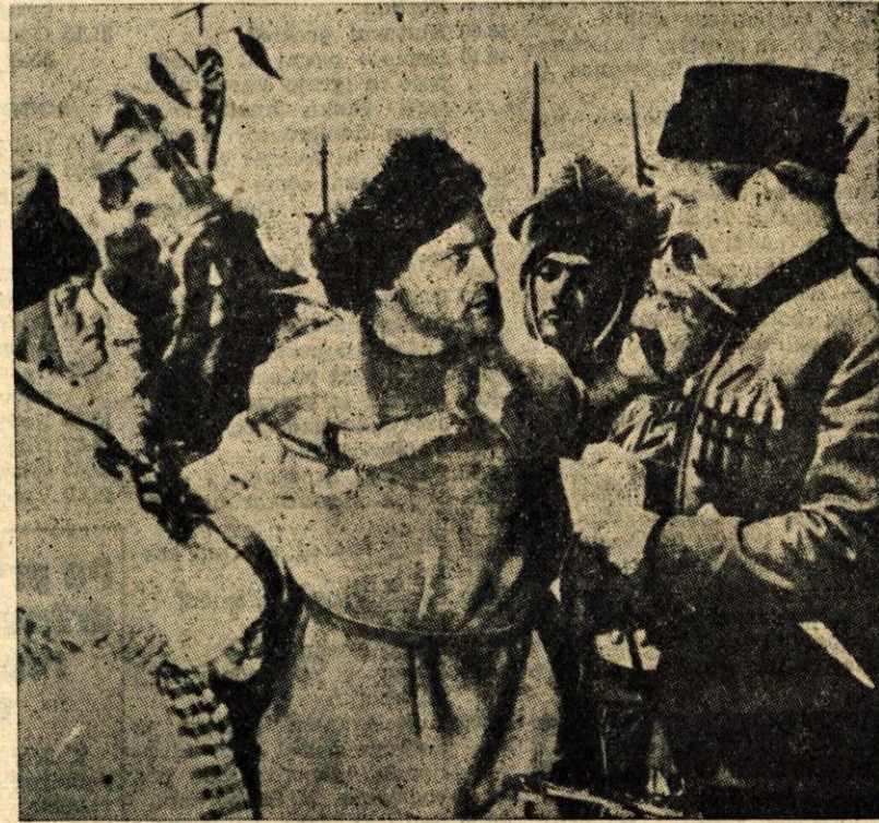
SLIKA ZGORAJ JE IZ FRANCOSKO-JUGOSLOVANSKEGA KOPRODUKCIJSKEGA FILMA »MIHAEL STROGOV«, KI SO GA POSNELI PO ZNANEM ROMANU JULESA VERNETA »CARSKI SEL«. FILM BOMO V KRATKEM VIDELI TUDI PRI NAS.