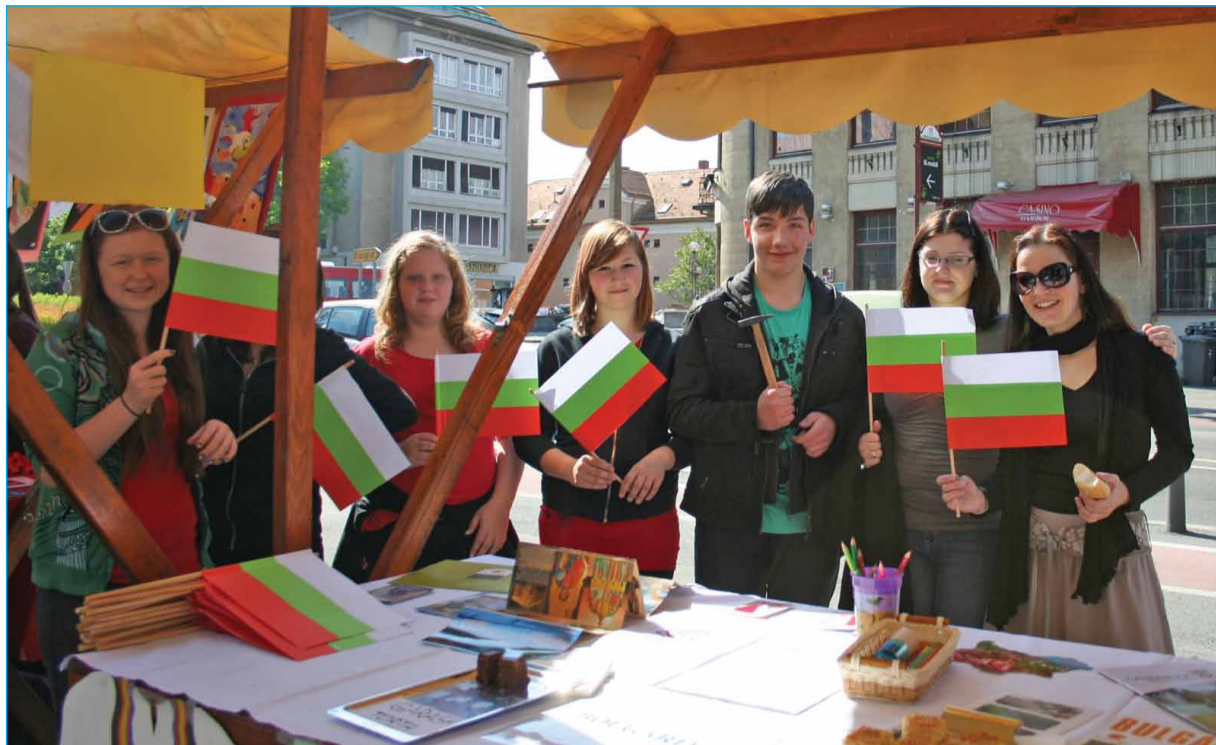
Na predstavitvi projekta v Mariboru