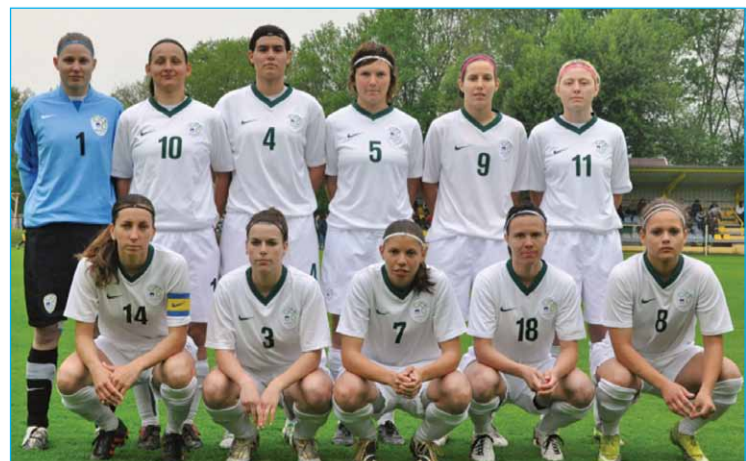
Državna ženska nogometna reprezentanca Slovenije

torej 2:0 za avstrijsko reprezentanco. Po premoru smo lahko videli nekaj resnih poskusov naših deklet, vendar je bila obramba Avstrijk zmeraj na mestu, kar pa ne moremo reči za naša dekleta. Gostje so z mirno igro in natančnimi podajami vedno znova izigrale našo obrambno linijo in še kar trikrat zatresle mrežo do konca srečanja. Končni izid srečanja Slovenija 0 : 5 Avstrija. Da je zanimanje za ženski nogomet tudi v naši občini veliko, pove pogled na tribuno športnega parka Stojnci. Navijači so kljub deževnemu vremenu ostali vse do zadnjega sodnikovega žvižga, zbralo se jih je približno 250. Kljub slabemu vremenu so Stojncani ponovno dobro izpeljali dogodek in pod streho spravili še eno mednarodno tekmo, na katero so zelo ponosni. Brez dvoma si lahko obetamo še več takšnih srečanj na igrišču ob Dravi.