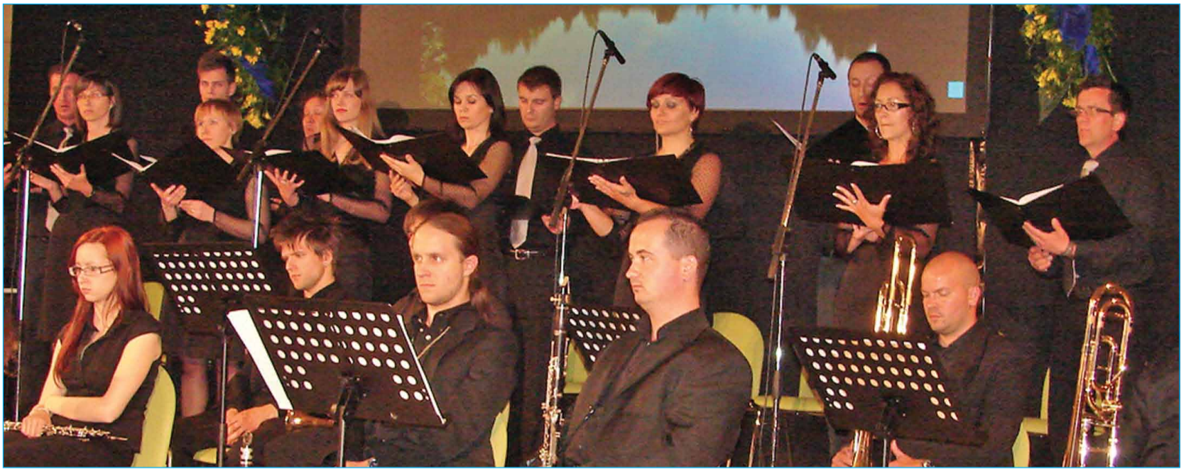
Pevci komornega zbora Kor Markovci