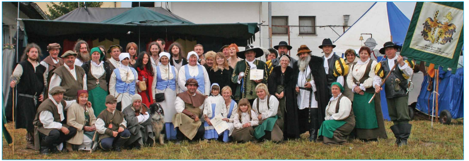
Skupinska fotografija udeležencev Breunerjevih dnevov

Skeč na temo sečnih in pašnih pravic v Šturmovcih, ki je podprt z zgodovinskimi zapisi, smo že odigrali na srednjeveški večerji. Breunerjevi dnevi so nadaljevanje zastavljene projekta. Sama tržnica je bila zelo lepo urejena, 'tržarji' pa zelo izvirni. Stojnski kovači so se predstavili s kovačijo, perice s pranjem perila in najrazličnejši izdelki, ki jih je bilo moč najti v tistih časih. Bukovska gospoda je na stojnicah ponudila rože in najrazličnejše dobrote, Borovci so se predstavili s svojo gostilno, svojo stojnico pa je imela tudi Breunerjeva spremljevalka. S pomočnicami je ponujala ročno izdelan nakit. Čebelarji in člani Turističnega društva občine Markovci so prav tako ponujali svoje izdelke. Na vseh stojnicah je bil na voljo