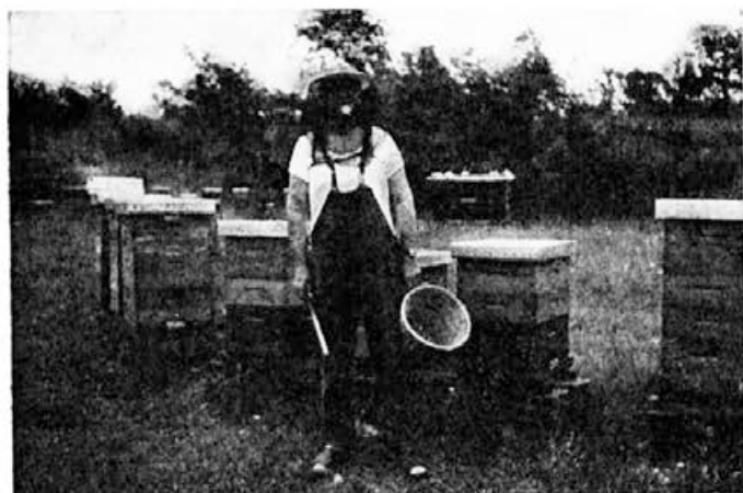
V letošnjem letu sem imel precej preglavic z roji

Helsinki — padejo pozimi temperature pod -40^{\circ}\text{C} , vendar ostanejo njihovi nakladni panji postavljeni posamično enako kot poleti in nezapaženi. Narejeni so iz smrekovega lesa, deske so 2,5 cm debele, kar je v skladu z njihovim standardom žaganja lesa. To popolnoma zadostuje tudi za njihove surove vremenske razmere. Seveda te ne dovoljujejo polovičarstva. Zazimijo samo močne družine, slabiče združujejo, ker jim vsa toplotna izolacija nič ne pomaga. Važno je, po njihovih izkušnjah, da v panjih ni prepaha, preveč odete družine pa so nemirne, se hitro vznemirijo in zato močnejše znoje.