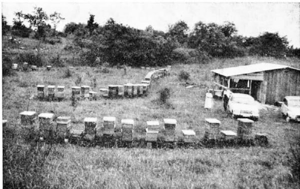
Moje stojišče nakladnih panjev v bližini Savudrije.

zorovano širi. Ob tej priložnosti me je tudi povabil, naj se kot gost udeležim posvetovanja v Veroni, kar sem rad sprejel. Tako mi bo omogočeno, da se bom seznanil s problemi, ki tarejo italijanske čebelarje. Ogleдал si bom tudi razstavo sodobne čebelarske opreme. Čebelarji na Tržaškem so z izrednim zanimanjem sprejeli poročilo s simpozija o diagnozi in terapiji varrooze v Bad Homburgu. Poročilo je objavil Slovenski čebelar. Ker italijanski čebelarski listi o tem niso izčrpno poročali, so italijanski čebelarji prosili za prevod poročila in se pohvalno izrazili o strokovni ravni Slovenskega čebelarja.