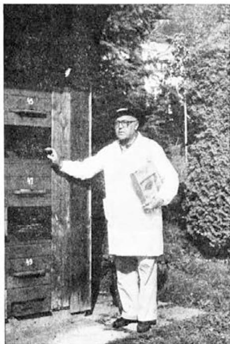
Doma pri vzrejnem čebelnjaku

tih in strokovni pomoči, ob svojem neugnanem zanimanju za življenje čebel in želji po znanju sem kmalu napredoval.