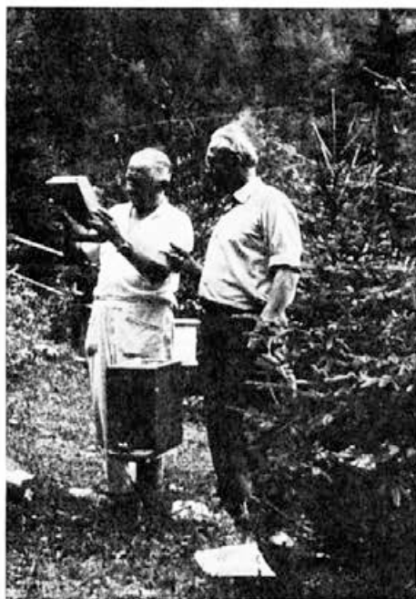
Na plemenilni postaji »Antona Janšec« pod Zelenico

19. Ali tudi sami ugotavljate možno navzočnost varroe in kako?