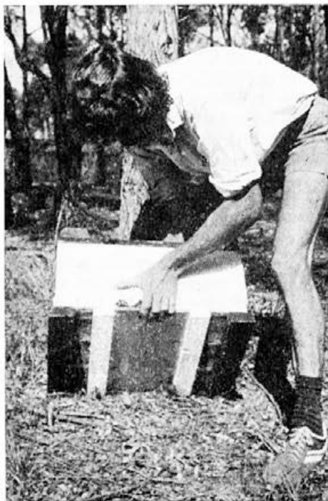
Rezervne družinice so dobrodošle tudi pri nakladnih panjih

na težavo, ker zavoljo sveže zalege hojevega medu nismo mogli iztočiti. Hojevec pa je čez zimo v plodišču ne samo nezaželen, ampak popolnoma odvečen, če nočemo imeti spomladi noseme v čebelnih družinah. V tem primeru ni drugega izhoda, kot da satje s hojevim medom in pokrito zalego prestavimo v medišče, v plodišče pa