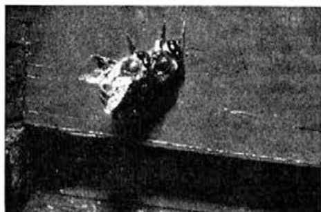
Bodimo pozorni na družine, ki odganjajo trote šele pozno jeseni!

namestim na izpraznjena mesta zdrave, enkrat ali dvakrat že zaležene sate. Pri tem pa moramo biti pozorni, da imajo ti sate že izčiščene celice, ker drugače matica v te sate ne bi zalegala. V tem času pa želimo imeti čim več zalege. Ko pa se pokrita zalega v medišču poleže, shranimo medene sate za pomlad ali pa med iztočimo. Če vsega tega nismo napravili, bo ostal manovec v plodišču čez zimo. Začetniki navadno računajo s tem, da dodajajo krmi za zimsko zalogo noseimak, fumidil ali česnov sok. Če ni kaj prida manovega medu v plodišču, potem je takšna računica do neke mere upravičena, seveda ob pogoju, da smo dali satje s hojvecem na skrajne robove panja. Ker pa je dodajanje navedenih preventivnih sredstev v jeseni v strokovnih krogih še nerazčiščeno in so mnenja različna, se ne smemo preveč zanašati na njihovo učinkovitost.