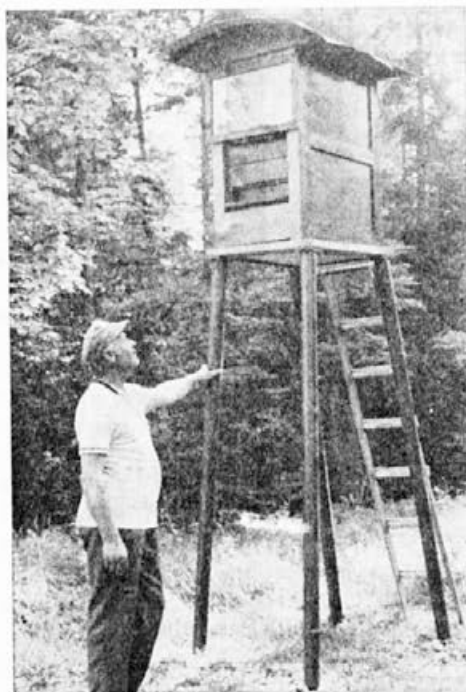
Družina na tehtnici je dobro zavarovana tudi pred medvedom

vozu takoj dostaviti dokumente za to določenemu.