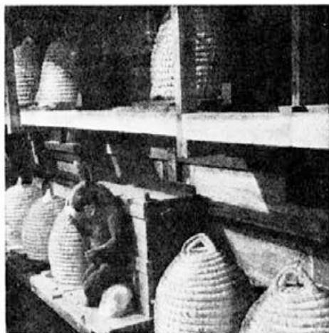
Tako so čebelarili v Podravini nekoč

nji so rabili po dve polnakladi, ker so se družine številčno močno razvile in zbrale velike količine medu, medtem ko so 9-satni panji kar vsi po vrsti rojili, medu pa niso dali praktično nič.