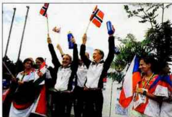
Zmage v štafeti so se veselile Norvežanke do 18 let.