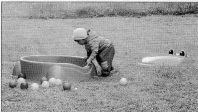
Kje so žogice?