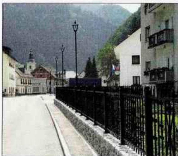
Cesto skozi Železnike krasijo luči in ograje iz Kroepe.

Kot so sporočili iz Iskraemeca, se je pretekli torek nadzorni svet na dopisni seji odločil, da za 1. avgust ponovno skliče skupščino družbe. Ker so roki za sklic relativno dolgi, so v objavi sklica predlagani sklepi okvirni, zlasti še o dokapitalizaciji, ki med lastniki še ni dogovorjena. V četrtek je nadzorni svet na redni seji obravnaval novi načrt finančne reorganizacije, ki ga je družba še istega dne predložila Okrožnemu sodišču v Kranju, pomeni pa usklajevanje pričakovanih upnikov v postopku prisilne poravnave, o katerem smo že poročali. Včeraj, v ponedeljek, naj bi se sestali lastniki še za dogovor o dokapitalizaciji in bodočem upravljanju družbe, kar je eden od ključnih še nerazrešenih vprašanj za bodoče poslovanje in celo preživetje družbe Iskraemeco. Zelo pomembno bo pri tem ravnanje in odločitve družbe pooblaščenke - DUS, od katere upniki zahtevajo, da se odpove večinskemu lastništvu. DUS ima tudi sklicano skupščino družbe za 19. julij, vendar to vprašanje ni na dnevnem redu. Sporočila o tem, kaj so se lastniki včeraj dogovorili, do zaključka redakcije še nismo prejeli. Š. Ž.