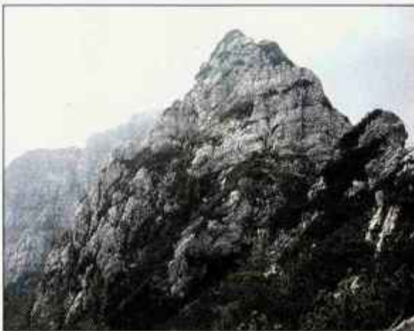
Tamle nekje, za tistimi skalami, je naš vrh.

Že omenjeni Rzenik ter njegov sosed Konj tvorita kratek gorski hrbet, ki leži med osrednjimi Kamniškimi Alpami in planoto Velike planine. Dostop na Rzenik je nemogoč, kar nam branijo neprehodne planjave ruševja. Vzpon, predvsem pa spust s Konja, sta zahtevna. Pot je zavarovana plezalna, ki je označena kot zahtevna in nevarna. Najtežavnejši del spusta je strm, gruščast žleb, ki je "zoprni", a nezavaran. Potreben je zanesljiv