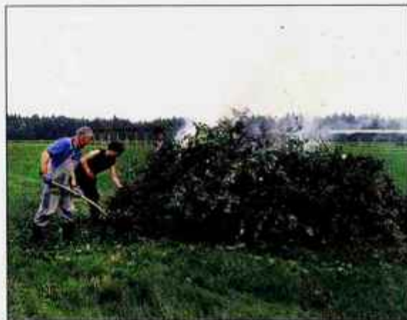
Pred tremi leti se je na Gorenjskem pojavila tako imenovana sadjarska kuga, letos je hrušev ožig ustaljen.

V najnovejši odločbi fitosanitarne uprave je razvidno, da je na območjih občin Cerklje, Kamnik, Kranj, Naklo, Preddvor, Radovljica, Šenčur, Škofja Loka, Tržič in Žirovnica, ki so opredeljena kot območja ustavitve, dovoljeno zmanjšanje infektivnega pritiska z izrezovanjem delov okuženih rastlin. Na gorenjskem obrobju so žarišča, v katerih je bil lani in predlani še zabeležen sum nastanka in razvoja bolezn. Take znake so inšpektorji zaznali v Belem v občini Medvode, v Miznem dolu pri Rovtah in v Opalah na območju Žirov. Preklicana so žarišča hruševga ožiga na območju Sore pri Medvodah, v Zgornjih Pirničah, Medvodah, Zlebeh, Bukovici pri Medvodah, Križu pri Komendi, Stahovici pri Kamniku, Vranji Peči, pri Radomljah in Trzinu.