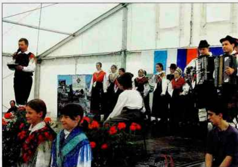
Otroška folklorna skupina iz Bohinjske Bistrice je navdušila.

Sodehajoči v kulturnem programu, ki ga je povezoval Boris Kopitar in v katerem sta sodelovala tudi otroška folklorna skupina iz Bohinjske Bistrice in bohinjska godba na pihala, so navdušili. Slovenske pesmi so z neverjetnim žarom peli in igrali Slovenci in njihovi svojci ter prijatelji iz Vojvodine, iz Skopja, iz Zenice, in želi aplavz občinstva.