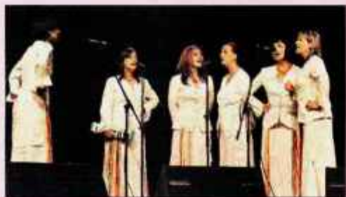
Klapa Baklje.

Festival Carniola Kranj je v petek na Gradu Khislstein v prijetnem ambientu starega gradu in ob toplim poletnem večeru gostil kar dve klapi: Klapo Levant z Reke in žensko Klapo Baklje, ki prav tako prihaja z Reke. Skupina šestih pevk je gledalce popeljala v izjemno poetično vzdušje Dalmacije. S svojo predstavitevjo dalmatinskih napevov in skladb ter istrskih melodij, sakralnega repertoarja ter drugih pop uspešnic, prilagojenih klapskemu načinu petja, sta dokazali izjemen občutek do glasbe in lepote petja. Klapi kipita od pozitivne energije, volje in navdušenja nad starogradske melosom. Da je to res, so dokazali tudi izrazi prisotnih, ki so nežno poplesavali ob spremljanju izjemno lepih pesmi. D. Ž.