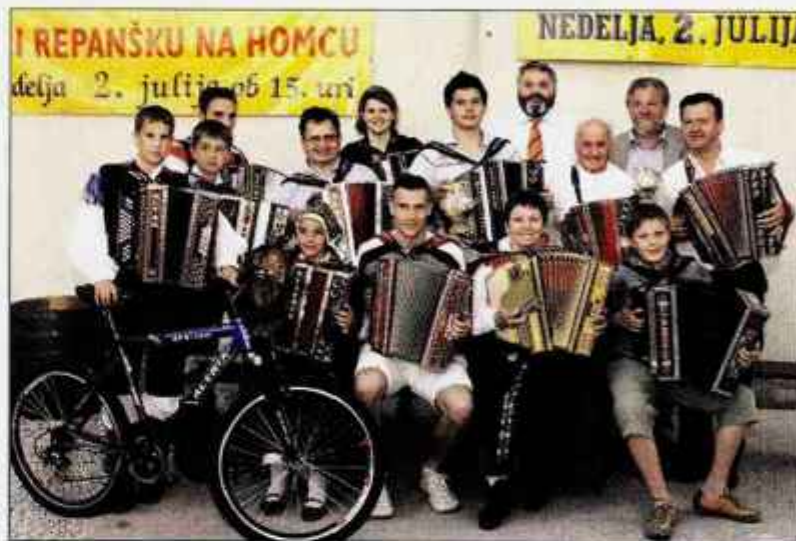
Najboljši harmonikarji na Homcu.