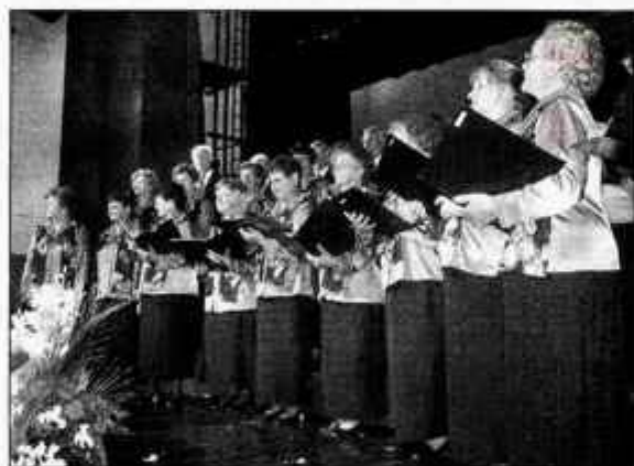
Pevke in pevci MePZ Društva upokojencev Kamnik.