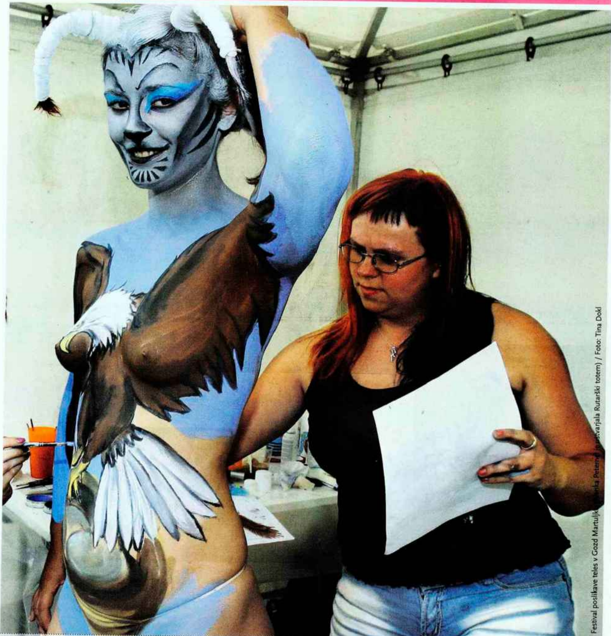
Festival poslikave teles v Gozd Martuljku