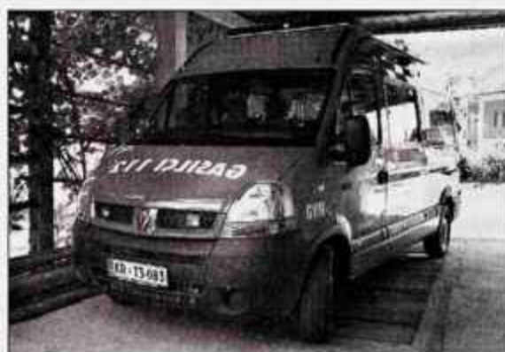
Novo gasilsko vozilo.