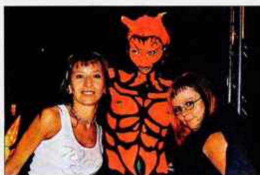
Zvečer je sledilo še tekmovanje za navdušence z UV barvami, kjer barve le pod UV lučmi pokažejo svojo moč.