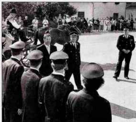
Minister Karl Erjavec pred častno četo gasilcev.

Duplje - S strunnim paradnim korakom, kolono gasilskih vozil domačega in sosednjih gasilskih društev ter s svečano podelitvijo priznanj, so v soboto v Dupljah zaključili praznovanje častitljivega stoletnega jubileja tamkajšnjega gasilskega društva. Med številnimi častnimi gosti je bil tudi obrambni minister Karl Erjavec , ki je dal znak za začetek parade, poudaril pomen gasilstva v Sloveniji, saj ni aktivno samo pri gašenju požarov, ampak tudi pri drugih zaščitno reševalnih dejavnostih. Po sveča-