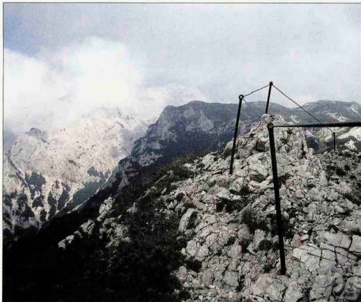
Z vrha Konja se odpira razgled proti osrčju Kamniških Alp, spredaj pa še delček plezalnih pripomočkov.

Do jeklenega konjička nas čaka še dobre pol ure hoje. Za nami je še en lep izlet.