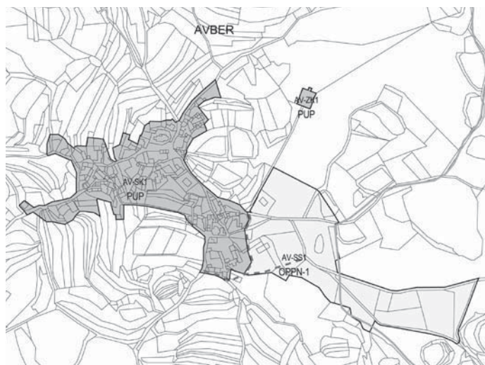
Slika 1: Avber: vzhodno od vaškega jedra so predvidene površine za širitev naselja v obsegu 48.992 m 2 .

Figure 1: Avber: east of the village core, areas for enlarging the settlement are provided for over an area pf 48,992m 2 .