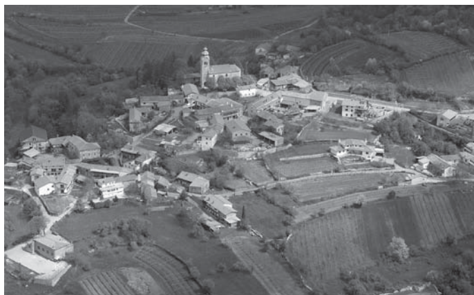
Slika 4: Avber - zgodovinsko jedro naselja.

Z vsebinskega vidika je obravnavani predlog sprememb in dopolnitev prostorskega akta prav tako v neskladju s krovnimi dokumenti in krovnim zakonom. Planiranje obsežnih zazidljivih površin naselij ni upravičeno. Strategija prostorskega razvoja Slovenije [2004] in Zakon o prostorskem načrtovanju - ZPNačrt, [2007] uvajata v skladu z mednarodnimi dokumenti načela pojmovanja sodobnega razvoja, ki temeljijo na modelu trajnostnega razvoja. Model narekuje načrtovanje poselitvenega razvoja v skladu s prostorskimi možnostmi in omejitvami, tako da se preprečuje prostorske konflikte in navzkrižja med različnimi rabami. Ob tem je treba zagotavljati kakovostno in privlačno bivalno okolje. V strategiji je poudarjeno, da zagotavljanje racionalnega širjenja naselij med drugim pomeni poudarjanje notranjega razvoja naselij. Pri tem sta pomembna ustvarjanje nove kakovostne strukture in rabe urbanega prostora ter ohranjanje kulturne, stavbne in naselbinske dediščine ter tudi biotske raznovrstnosti in naravnih vrednot.