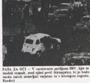
PAŠA ZA OČI - V razstavnem paviljonu IMV, kjer so prikazani modeli renault, med njimi prvi štiriinjak, ki je bil v Novem mestu izdelan, izdelani so v letih 1981 in 1982.