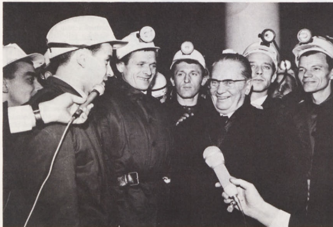
Tovariš Tito med prisrčnim razgovorom z rudarji

2. Pravice in dolžnosti na področju ljudske obrambe uresničujejo ženske enakopravno z moškimi. Posebnosti glede izvrševanja posameznih dolžnosti žensk določa zakon in na njegovi podlagi sprejeti samoupravni akti.