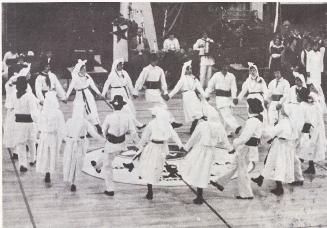
Razigrani plesalci „KRESA“ so nastopili tudi 19. aprila na veliki prireditvi ob sprejemu Titove štafete v športni dvorani v Novem mestu. Zaplesali in zapeli so nekaj belokranjskih in dolenskih plesov, na koncu pa so povedli še drugo mladino v jugoslovansko kolo „Druže Tito, ljubičice plava...“