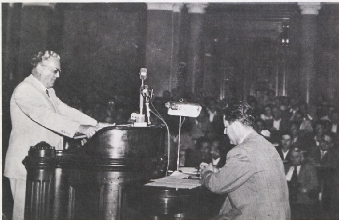
Predsednik republike Josip Broz Tito govori na izrednem zasedanju zvezne skupščine 27. 6. 1950 o uvedbi delavskega samoupravljanja, osnovanju delavskih svetov in izročitvi tovarn v upravljanje delavcem

Prvi maj je predsednik Tito slavil s sodelavci na Brdu in med ljudstvom pri Joštu na Kranjem, obiskal je Dražgoše in sprejel odpotce delovnih ljudi iz