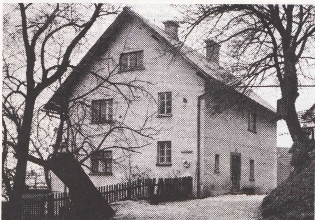
V tej hiši se je v noči s 17. na 18. april 1937 odločala usoda slovenskega naroda. (prisrčno, iskreno...)