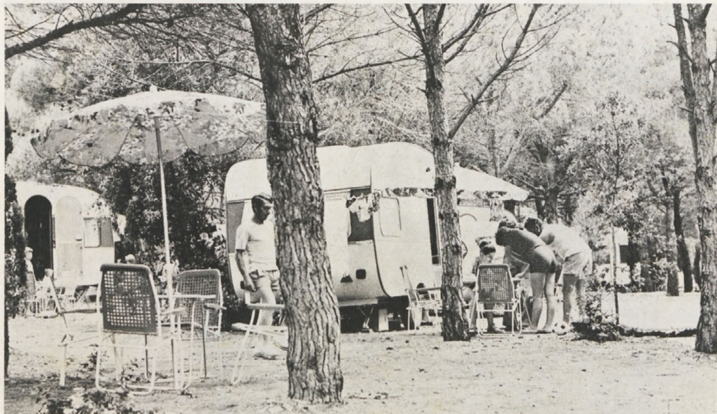
V Pakoštanah, kjer imamo delavci IMV svoj počitniški karavan kamp, ni ugodno letovati samo zaradi urejenega prevoza in izredno nizkih cen, marveč tudi zaradi izredno lepe naravne lege kampa in prečudovite okolice. Še posebej navdušuje možnost izletov na Kornatske otoke, ki veljajo v svetu za izjemno naravno znamenitost.

Ker sem se odločil za letovanje v Pakoštanah, bom pri svoji poenterki dobil dve prijavnici. Izpolnjeni prijavnici bom dal podpisati predpostavljenu, ki mi bo s podpisom odobril dopust v navedenem roku. Preko poenterke ali osebno bom prijavnico dostavil službi Počitniške skupnosti v kadrovskem oddelku, kjer mi bodo prijavnico potrdili. Rok za prijavo je do 31. 5. 1977, zato bom moral prijavnico oddati do konca maja. Seveda po tem ne bom smel odjaviti svoje prijave, ker bom moral plačati polno ceno najemnine. Prijavo bom lahko odpovedal samo v primeru višje sile.