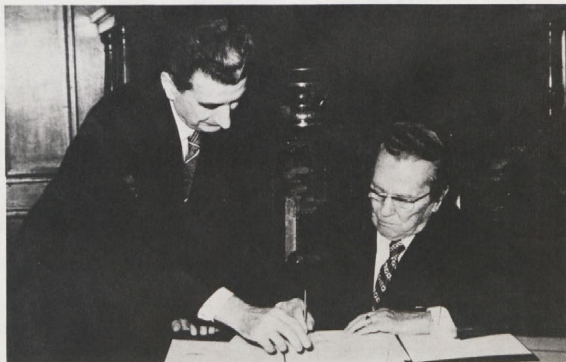
Predsednik republike Josip Broz Tito 26. 11. 1976 podpisuje zakon o združenem delu v skupščini SFRJ. Poleg njega je Kiro Gligorov, predsednik skupščine

„Titova osebnost predstavlja izkristalizacijo ustvarjalnosti, borbenosti in smisla za resničnost,“ je med drugim dejal tovariš France Popit na slavnostni seji CK ZKS ob 40-letnici ustanovitve KP Slovenije. S temi besedami je povedal o dragem tovarišu Titu to, kar vsi nosimo v srcih in naših svetlih majskih željah za našega predsednika.