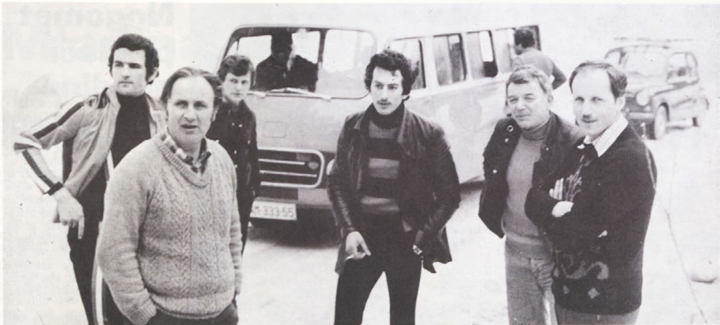
Smučarji, ki so nas uspešno zastopali na Soriški planini, so se morali ustaviti, čeprav našemu minibusu ta počitek ni bil potreben.