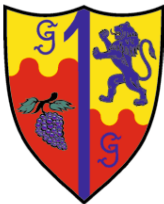
Grb princa Gašperja I.