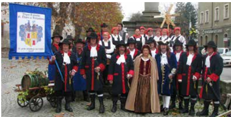
11. 11. 2008 na umestitveni prireditvi s člani Kulturno-turističnega društva Klopotec Soviče - Dravci pred Marijinim stebrom na Minoritskem trgu na Ptuj

Prinčevo darilo je bil koren vinske trte, opremljen z listino, in buteljka vina lastne pridelave iz vinograda v Halozah.