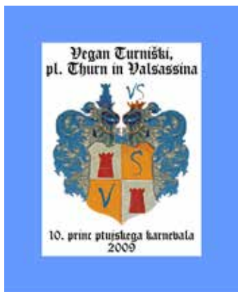
Prinčev grb je zasnovan po originalnem Thurnovem.