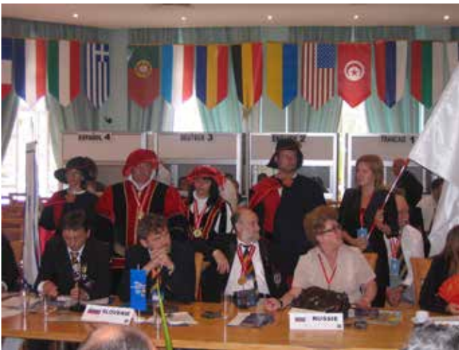
Princ s spremstvom na praznovanju FECC Dies natalis leta 2007 na Ptuju

Prinčevo darilo je bilo vino s pečatnim odtisom njegovega grba ter pivski vrč z grbom.