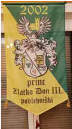
Grb tretjega ptujskega princa