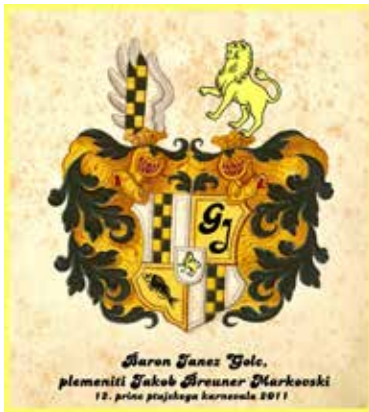
Osnova za prinčev grb je bil rodbinski grb Breunerjev.