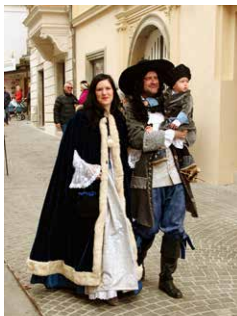
15. mestni pustni korzo 2019, princ, princesa in mali princ