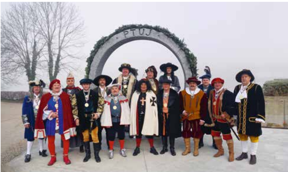
Princi karnevala 2019

Od četrtega princa karnevala naprej predstavlja na Ptujem princ karnevala neko zgodovinsko osebnost svoje okolice.