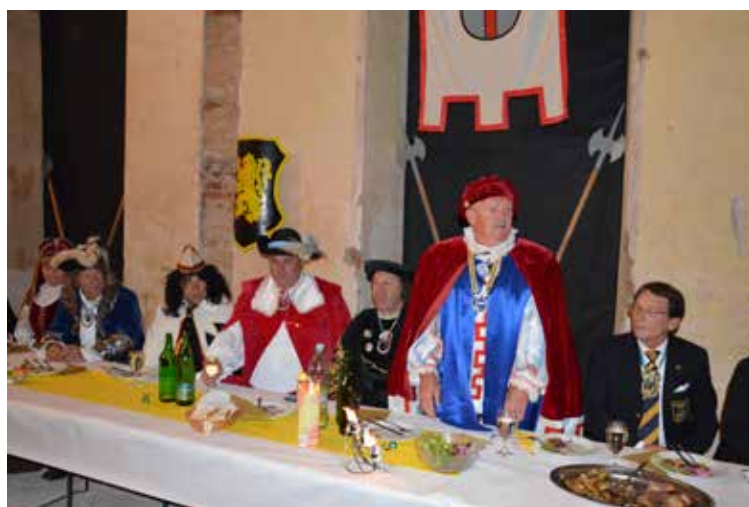
Prinčev večer na Turnišču leta 2015

Buteljka lastnega pridelka z geografskim poreklom iz Vareje v Halozah: vrhunsko vino – rulandec (sivi pinot) in liker kurentov napitek (ptujska viagra), oboje pod znamko kurenta (nalepka z značilnim Miheličevim kurentom, ki ga je slikar dovolil uporabljati v ta namen).