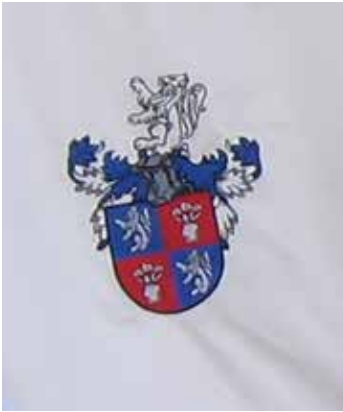
Prinčev grb je povzet po izvornem Kacherlovem v modri, rdeči in srebrni barvi.