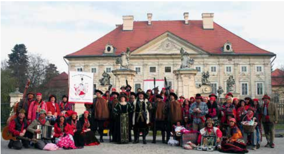
Spominska slika na dan inauguracije 11. 11. 2012 z Etnografskem društvom Cigani Dornava in gardo pred dornavskim gradom