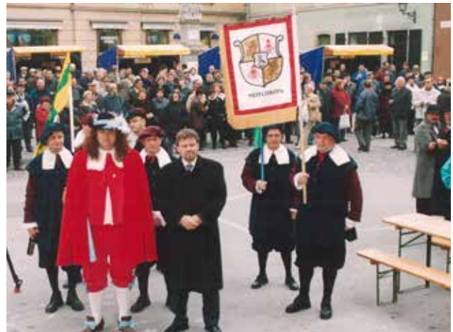
Na Mestnem trgu na martinovo leta 2002

svoje prinčevsko ime Moschkon in leta 2006 na Hajdini odprl picerijo Moschkon. Princ je za svoje darilo izbral kipec rogatega koranta iz terakote. Buteljka vina, ru-meni muškata letnik 2002 lastne proizvodnje, pa je imela prinčevo nalepko.