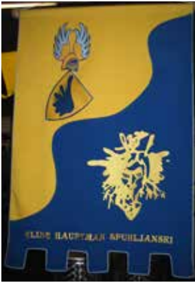
Prinčev grb ponazarja Dravo in rodovitno Ptujsko polje, ki mu vlada kurent.