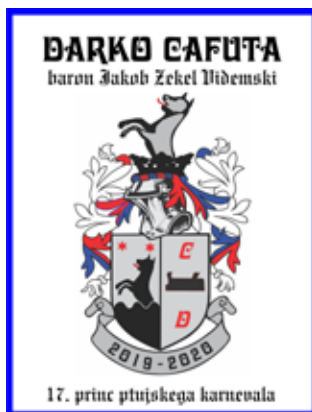
Grb je povzet po grbu rodbine Zekel – Szekely.