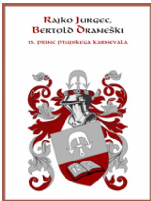
Osnova za prinčev grb je bil grb rodbine Draneških.