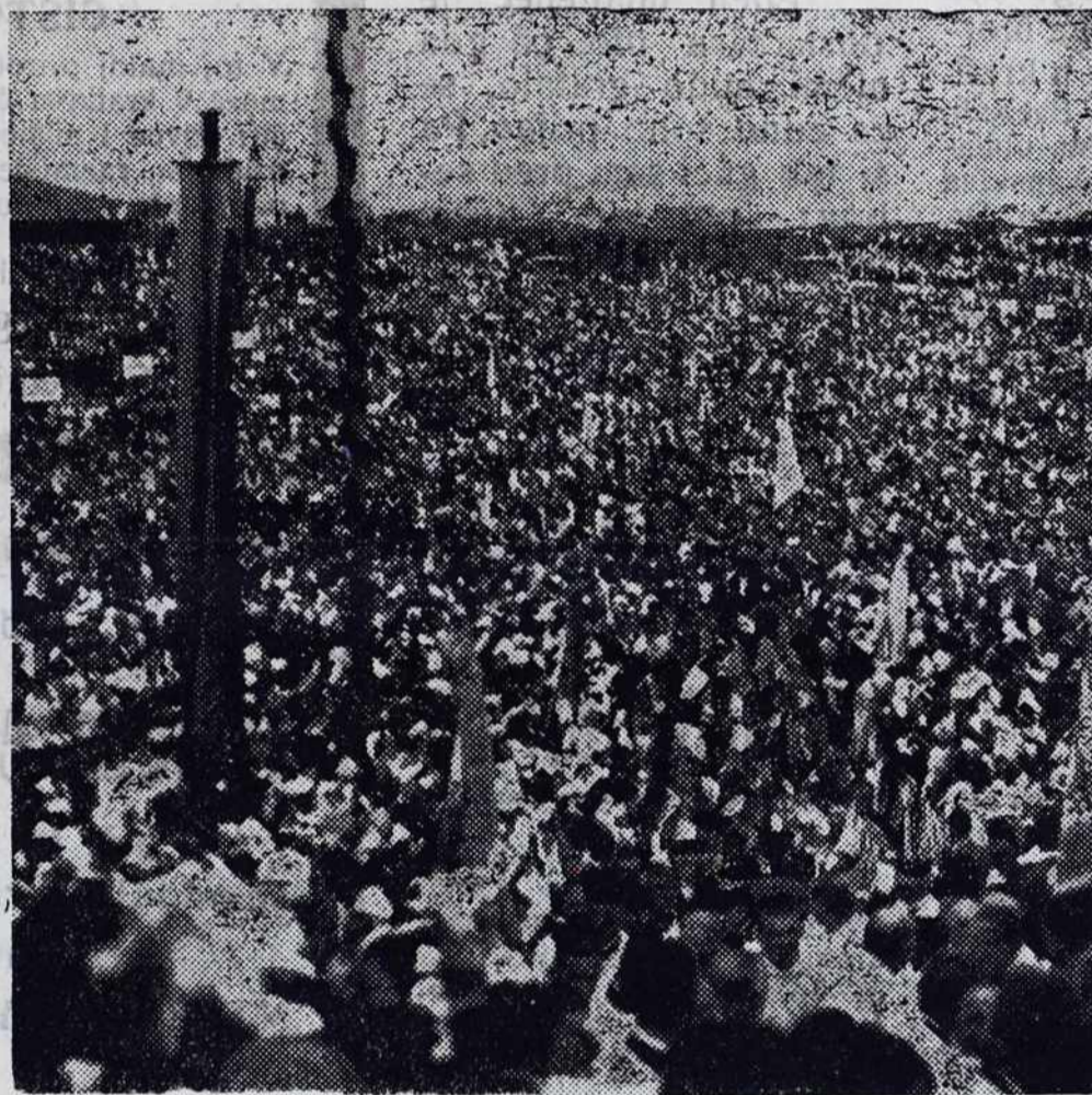
Vnožine naroda razvrščene po dekanijaj desno.

Med svetovnov bojnov je bilo. V večih družinaj ne bilo doma moškoga, vse je bilo na bojišči. Ženske so mogle same delati, pa vsega ne so zmagale ar so bile slabotne i deca pregingava. V Filovcih je bila neka siromaškejša žena, ki ne dobila nikše pomoči, da bi njej što pomogeo travnik pokositi, sama si ga je pa nikak ne mogla. Potožila se je pokojnomi plebanoši g. Baša Ivani. Ka so te napravili? Odločili so se ka do šli sami kositi Stopijo v nedelo na predganco i naznanijo sledeče: Vütro me nede doma, zato ka morem iti v Filovce travo kositi. To je pomagalo. Drügo jütro, prle kak so oni ta prišli, je travnik bio že pokošen. Pokosili so ga sami Filovčarje.