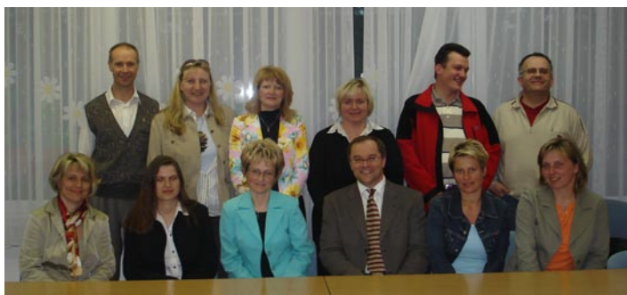
Predstavniki svetov staršev na ustanovni seji v Osnovni šoli Domžale, ki je bila tokrat gostitelj.

Tako smo na ustanovni seji začrtali smernice nadaljnega delovanja Aktiva v naslednjem šolskem letu: prizadevanje za priznanje izvenšolskih dejavnosti kot obveznih izbirnih predmetov (Glasbena šola in druge, kjer učenec konča program predpisanega izobraževanja z verificiranim spričevalom oziroma zaključnim izpitom), za zmanjšanje števila teh predmetov in pravičnejši sistem njihovega ocenjevanja glede na vsebino predmeta. Aktiv se bo zavzemal za uvedbo fleksibilne diferenciacije učencev pri nivojskem pouku, saj je sedanje ločevanje učencev v tri različne nivoje glede na znanje pokazalo tudi negativne strani, predvsem z vidika socializacije in razredne pripadnosti učencev. Tudi zakon je sedaj