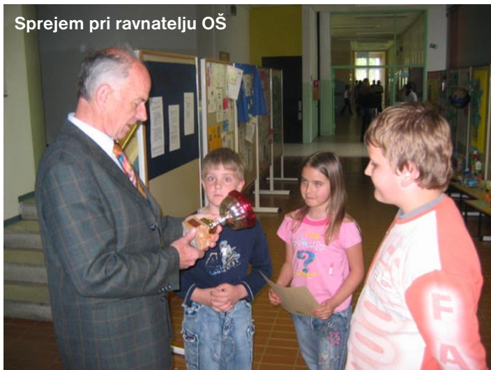
Sprejem pri ravnatelju OŠ