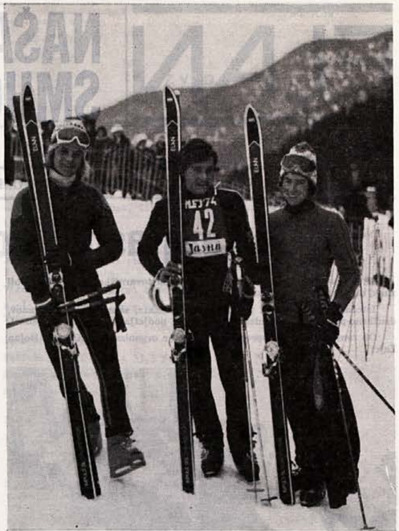
Svedski mladinci so prislužili dobro ime Elanovim smučem med vrhunskimi tekmovalci