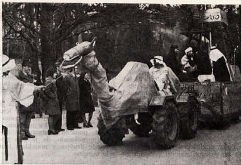
»Ali-Ben-Čufank Paša« s kamelo na sprevodu