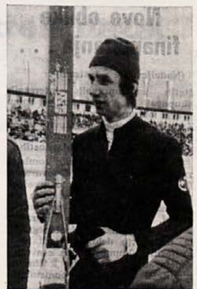
Rekorder Walter Steiner skače z našimi smučmi