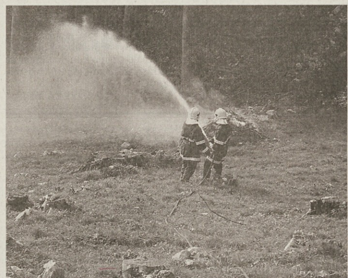
Gašenje požara v naravi

je krenilo na pot in z zgornje strani cerkve izvedlo napad. Ob požaru je pri cerkvi potekala simulacija nudenja prve pomoči krajankama, ki sta jo izvedli dve bolničarki.