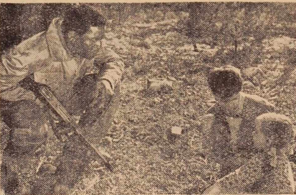
Prizor iz slovenskega filma »Dolina miru«, ki je bil ugodno sprejet na letošnjem festivalu v Cannesu

Ne glede na to, komu podelijo v Benetkah zlatega leva (leva imajo Benečani tudi v grbu), je očitno, da potrebuje festivalska zamisel svežega vetra, če ne celo kakšnega drugega uspešnejšega zdravila. Seveda drži, da se je festivalska zamisel izrodila, če imajo od nje finančne koristi turistični in drugi mogotci, filmska ustvarjalnost pa po bere le drobtinice. Učimo se na izkušnjah in največja je nedvomna ta, da ne kaže prireditelj festivalov zaradi festivalov, temveč zaradi napredka filmske umetnosti v svetu.