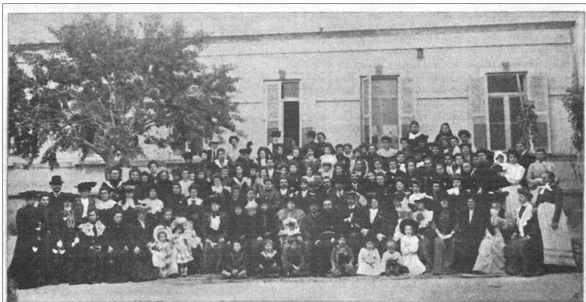
Krščanska zveza Slovenk.

Članice in člani Krščanske zveze deklet, ki je bila ena osrednjih slovenskih organizacij v Egiptu pod pokroviteljstvom katoliške Cerkve (Koledar Družbe sv. Mohorja za navadno leto 1906, str. 47).